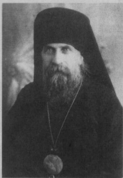
Божие милости Николай, епископ Сестрорецкий