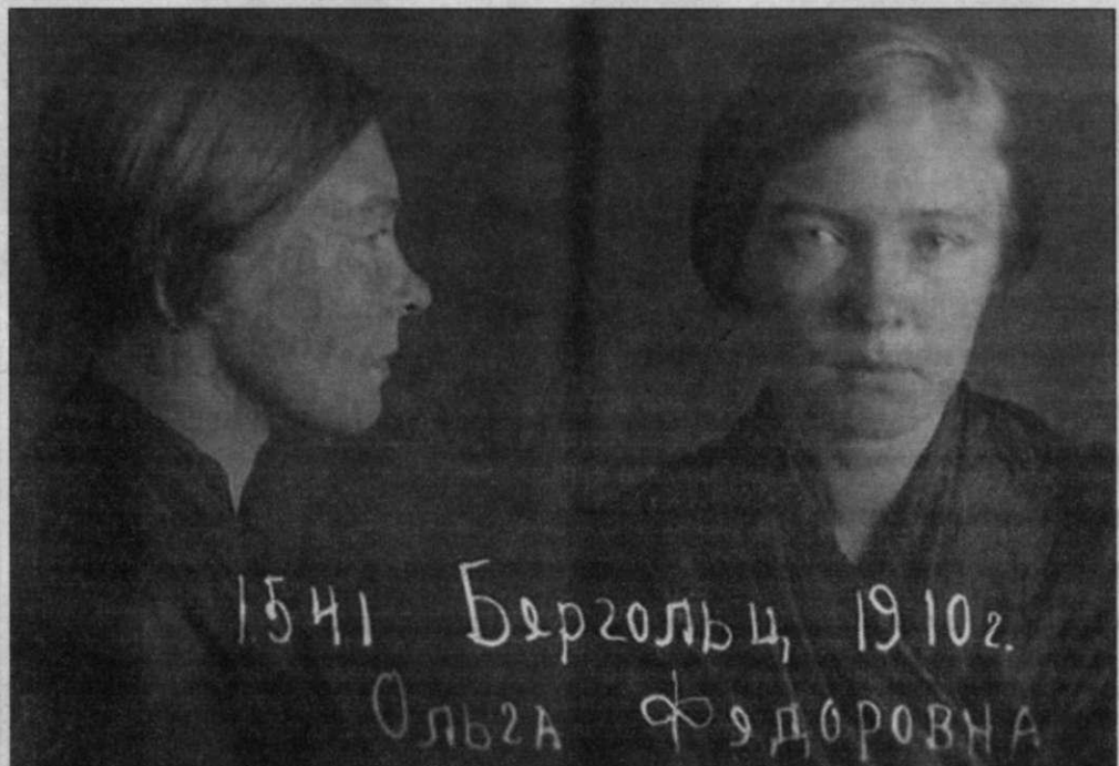
14 декабря 1938 г. Фотографии из архивного следственного дела № П-8870.