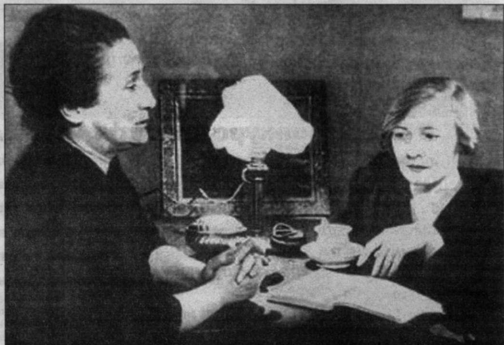
Анна Ахматова и Ольга Берггольц. Именно с Анной Ахматовой передала из блокадного города Берггольц записку в Москву сестре. В ней она написала, где прячет свой дневник. «Мусинька, на всякий случай, — только на всякий случай», — писала она.

(Архив Управления Федеральной службы безопасности по Санкт-Петербургу и Ленинградской области.)