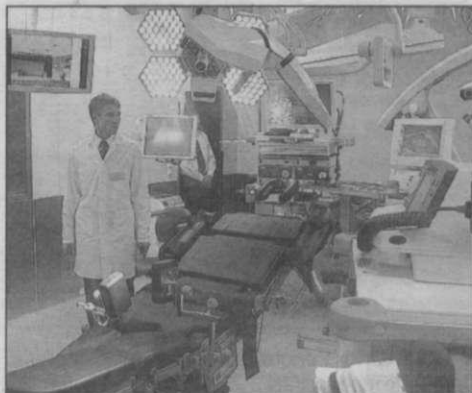
Современное оборудование в операционном блоке позволяет проводить операции в режиме телетрансляции с любой точкой мира