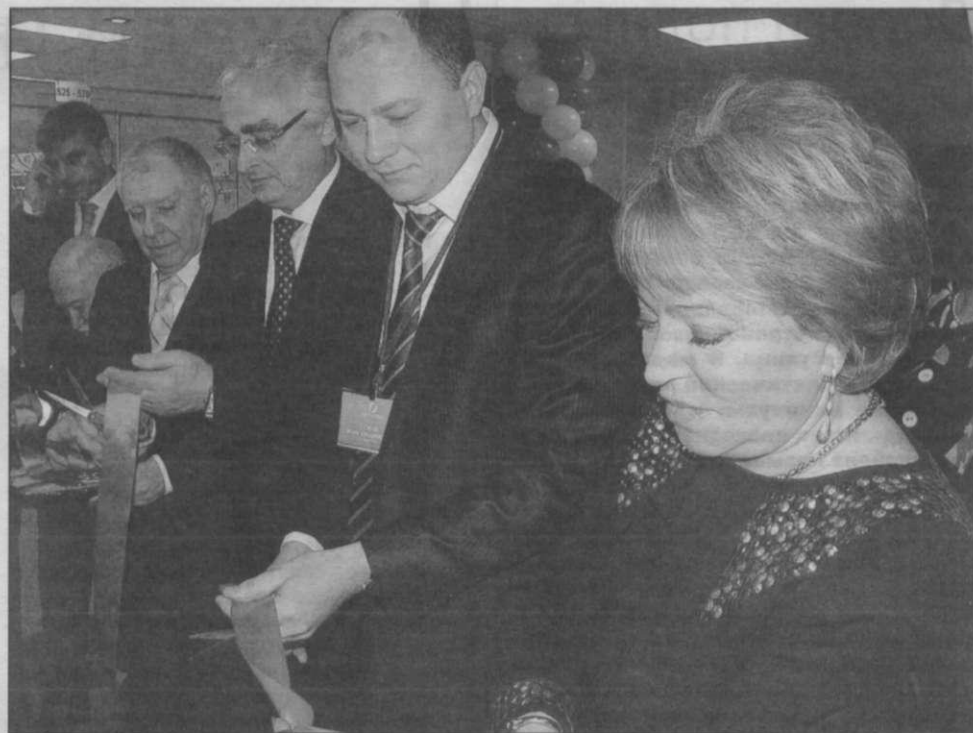
Торжественное открытие онкологического центра в Песочном

Больница в Песочном начала строиться еще в 1988 году, но проект был «заморожен» из-за нехватки средств. Строительство возобновилось лишь несколько лет назад, причем практически с нуля. В 2008 году открылась первая очередь центра, а с ноября 2010 года начала работу 2-я очередь — открылось