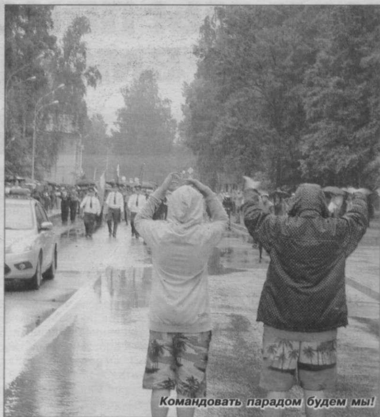
Командовать парадом будем мы!

В минувшие выходные город Зеленогорск отметил свою 463-ю годовщину. По традиции торжество имело широкий размах и длилось несколько дней. Началось с открытия выставки сообщества зеленогорских художников в выставочном зале «Арт-курорт». Кульминацией праздника стали вечерний концерт, шоу фонтанов, лазерное шоу и фейерверк. Во время концертов горожан развлекали многочисленные творческие коллективы, знаменитые исполнители симфонической и оперной сцены, российской эстрады и даже гости из Великобритании – легендарная группа Eruption со своим хитом «One way ticket to the Blues». Администрация Курортного района и органы местного самоуправления Зеленогорска сделали жителям несколько подарков, улучшающих облик города, который и так славится своей ухоженностью и красотой. Центральная аллея Зеленогорского парка культуры и отдыха превратилась в огромную ярмарку, куда слетелись многочисленные мастера художественного жанра, прикладного искусства и не только. Народные гуляния длились целый день и завершились на завтра легкоатлетическим забегом. Но не стоит забегать вперед, расскажем обо всем по порядку.