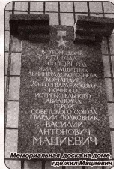
Мемориальная доска на доме, где жил Мациевич