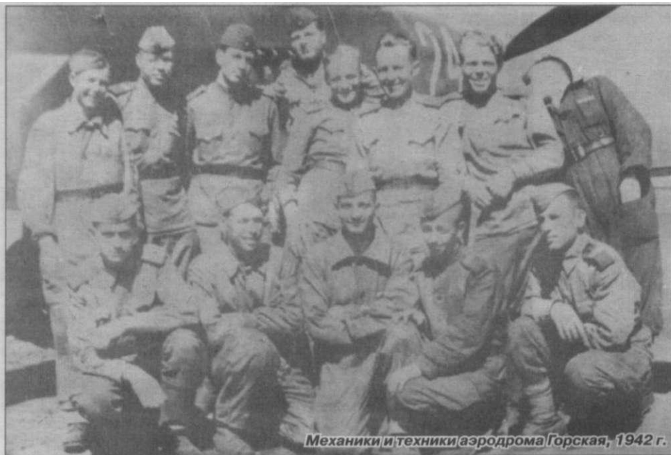
Механики и техники аэродрома Горская, 1942 г.