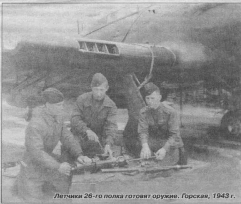
Летчики 26-го полка готовят оружие. Горская, 1943 г.

Рядом с настоящим аэродромом, ближе к Лисьему Носу, был построен фальшивый, с целью дезориентировать противника. На летном поле стояли «самолеты» из фанеры, это были муляжи, изготовленные в цехе театральных декораций на улице Писарева в Ленинграде. Обманный аэродром несколько раз подвергался массированной бомбардировке, тем самым, спасая настоящий аэродром.