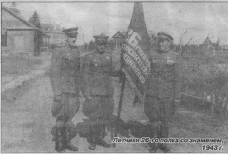
Летчики 26-го полка со знаменем, 1943 г.