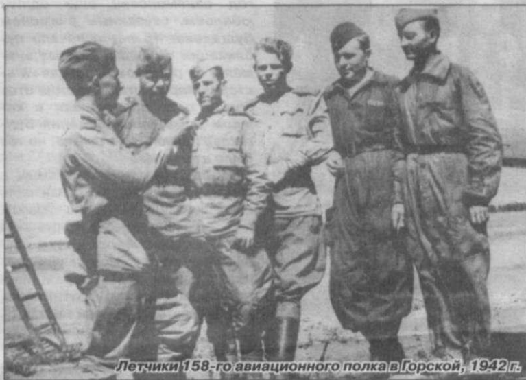
Летчики 158-го авиационного полка в Горской, 1942 г.