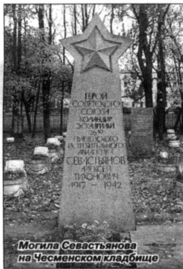
Могила Севастьянова на Чесменском кладбище