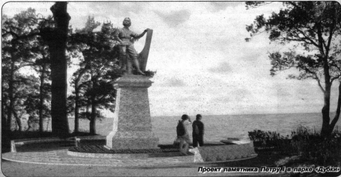
Проект памятника Петру I в парке «Дубки»

Кстати, в 1900 году в Сестрорецке в санатории «Сестрорецкий курорт» на берегу Финского залива был установлен памятник Петру Великому, на