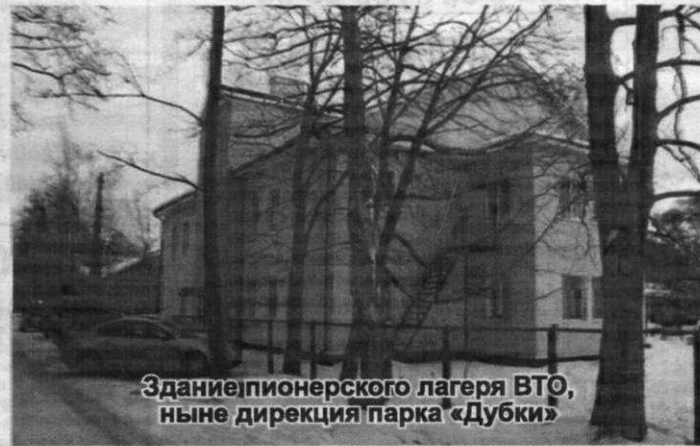
Здание пионерского лагеря ВТО, ныне дирекция парка «Дубки»

комсомола постановила создать детские коммунистические группы юных пионеров имени Спартака. Этот день считается Днем Рождения Пионери.