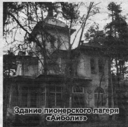
Здание пионерского лагеря «Айболит»