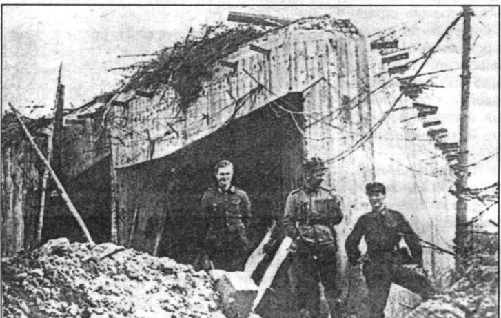
Финские солдаты у дота «Миллионер», июнь 1942 г.