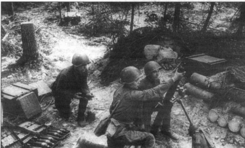
Карельский перешеек. Июль 1941 г.