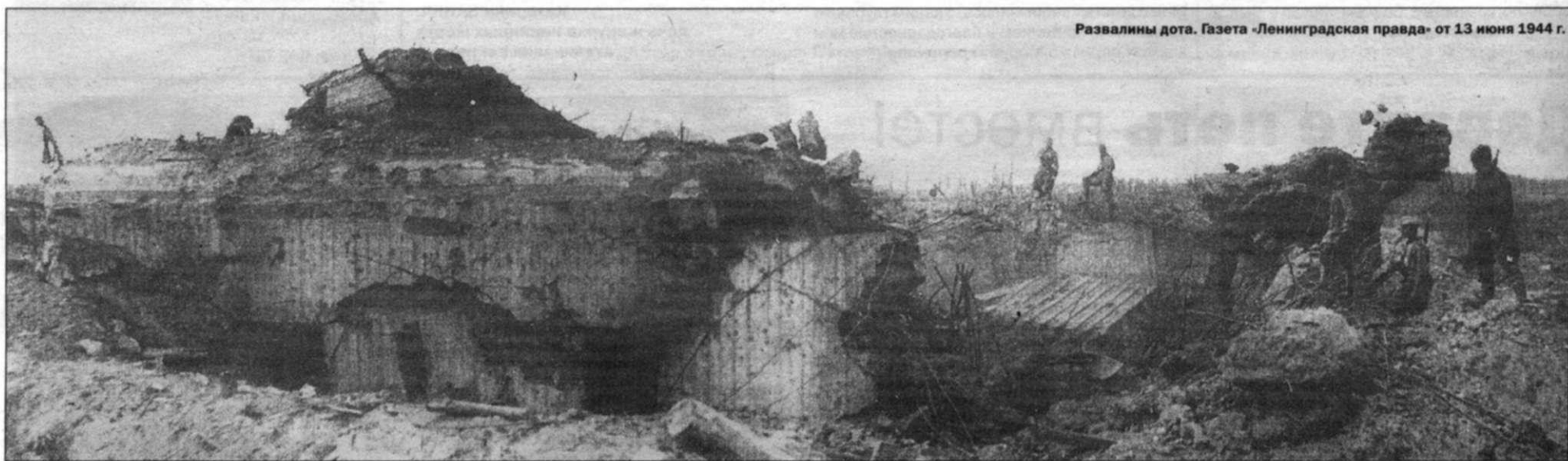
Развалины дота. Газета «Ленинградская правда» от 13 июня 1944 г.

Уточнение. В первой части материала в №20 нашей газеты следует читать: «упреждающий удар по 18 аэродромам» и «две дивизии и десять стрелковых полков».