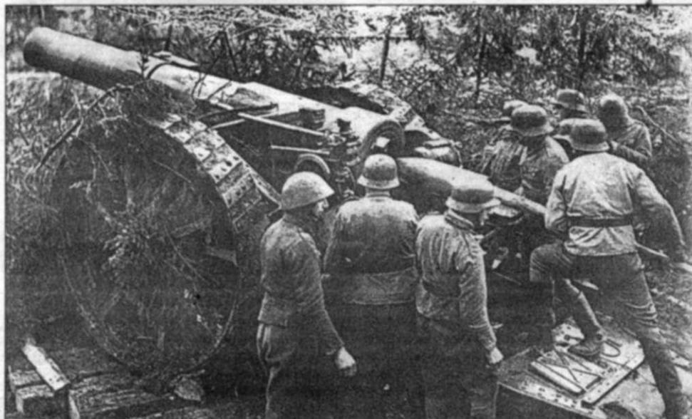
31 августа 1941 г. Символические выстрелы по деревне Майнила