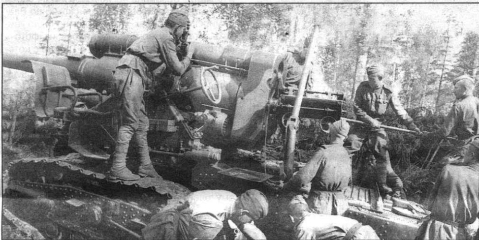
Расчет гаубицы Б-4. Карельский перешеек, июнь 1944 г.

К сожалению, надпись, несмотря на предложение автора, была выполнена только на русском языке, хотя этот дот с 1941 до