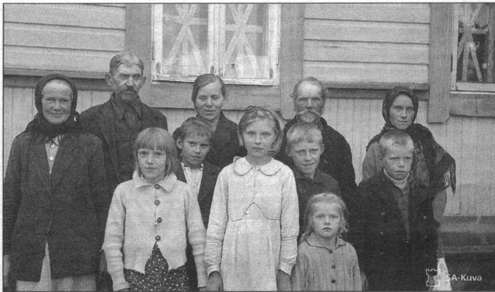
Ингерманландцы из деревни Александровка (Белоостров). Фото начало сентября 1941 г., Яппила

Конструкция пулеметных, а тем более артиллерийских дотов была рассчитана на отражение противника со вполне ожидаемой сто-