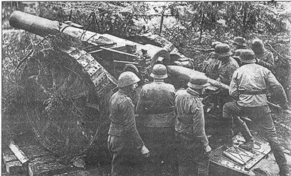
31 августа 1941 г. Символические выстрелы по деревне Майнила