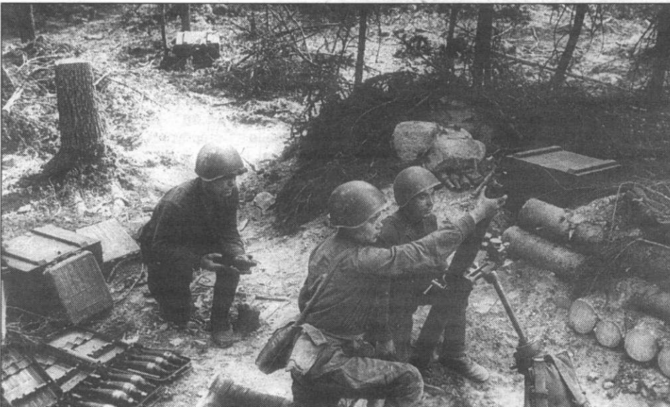
Карельский перешеек. Июль 1941 г.