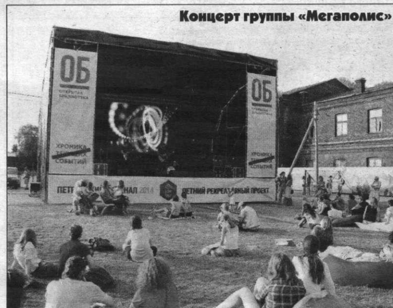
Концерт группы «Мегаполис»