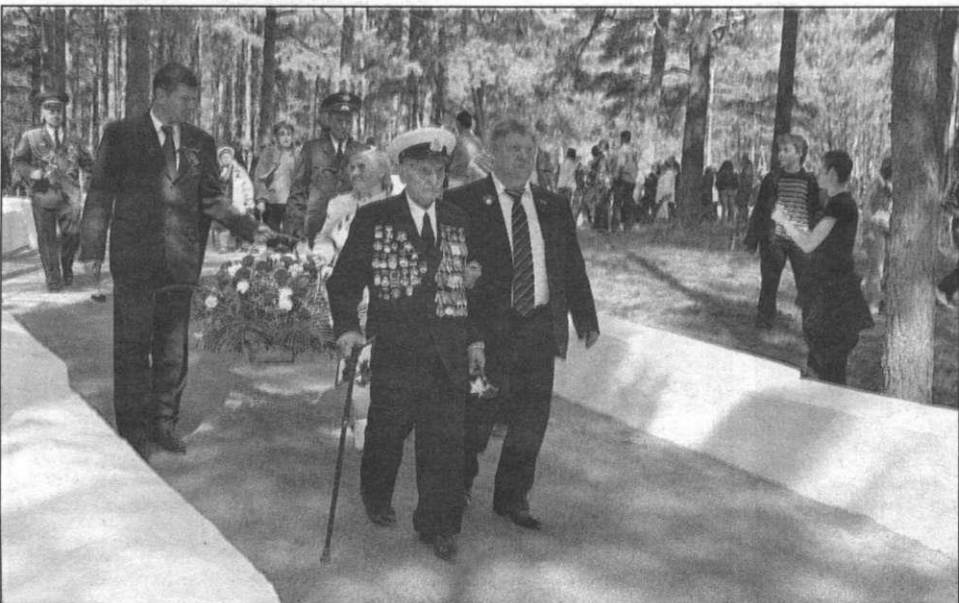
Сестрорецкое военно-мемориальное кладбище. 9 мая 2012 г.