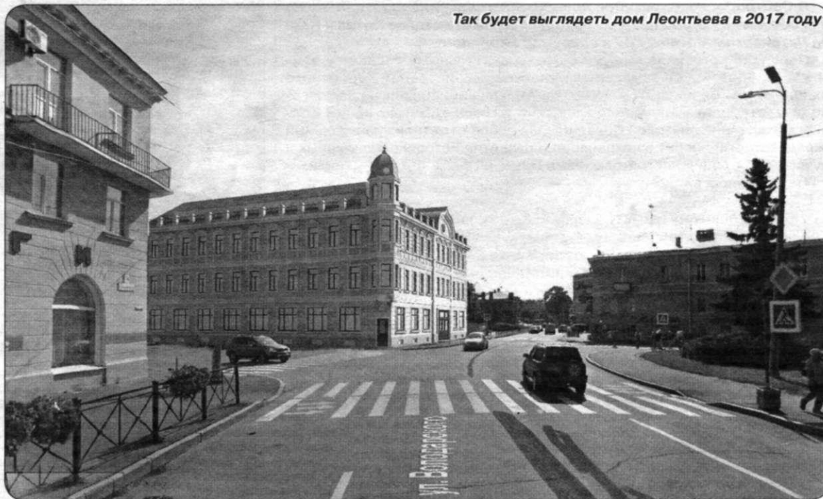
Так будет выглядеть дом Леонтьева в 2017 году