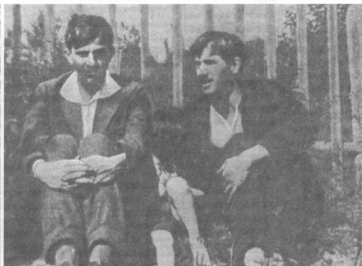
Маяковский и Чуковский в Куоккале (1915)