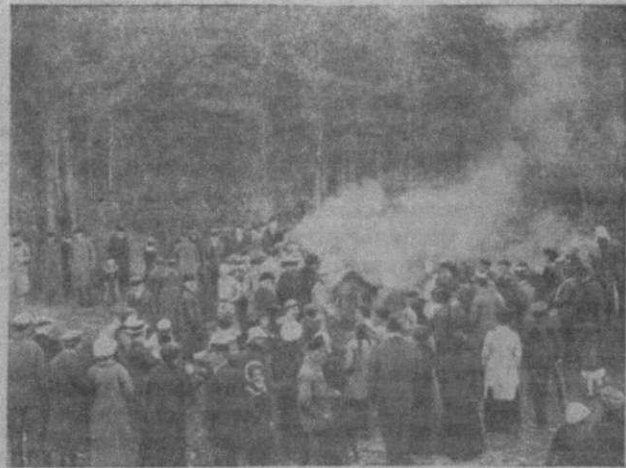
Испытание огнем модели дачи, оштукатуренной новозобретенным огнеупорным составом.

Страшный пожар опустошил пылче летом излюбленный петербуржцами дачный поселок Куоккала, по финляндской жел. дор. «Грози не грянет, мужик не перекрестится». Куоккальские дачевладельцы спохватились и воспользовались приглашением шведа и датчанина, изобретивших огнеупорную штукатурку. В конце августа состоялось публичное испытание деревянной модели домика, сплошь покрытого этим составом. Двухчасовой огонь не мог справиться с охранительной штукатуркой, и домик вышел из костра невредимым. Легко подычь составом нехитрую игрушку, — но как уберечь все сплошь деревянные части более сложной постройки от проникновения огня? Многие дачевладельцы, однако, тут же заказали изобретателям огнестойкия дачи.