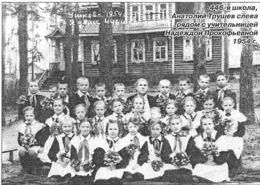
Ушково, 1954 г. 2 класс, 446-я школа