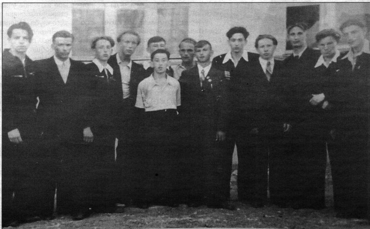
Выпускники 10-го класса 437-й школы