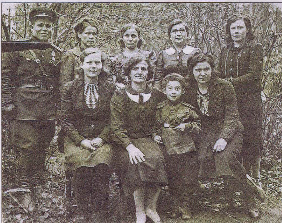
Сотрудники детского сада «Очаг» в годы войны

Работала школа, в которой обучались 143 ребенка. Учащиеся помогали колхозу «Новоселки». Школьники, достигшие 15 лет, направлялись в ремесленные училища. Была создана художественная самодеятельность, руководителем ко-