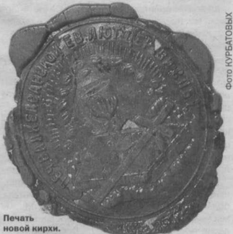
Печать новой кирхи.