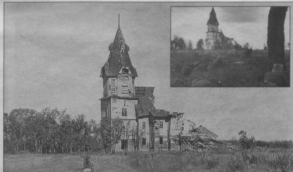
Фото сентября 1941 г.