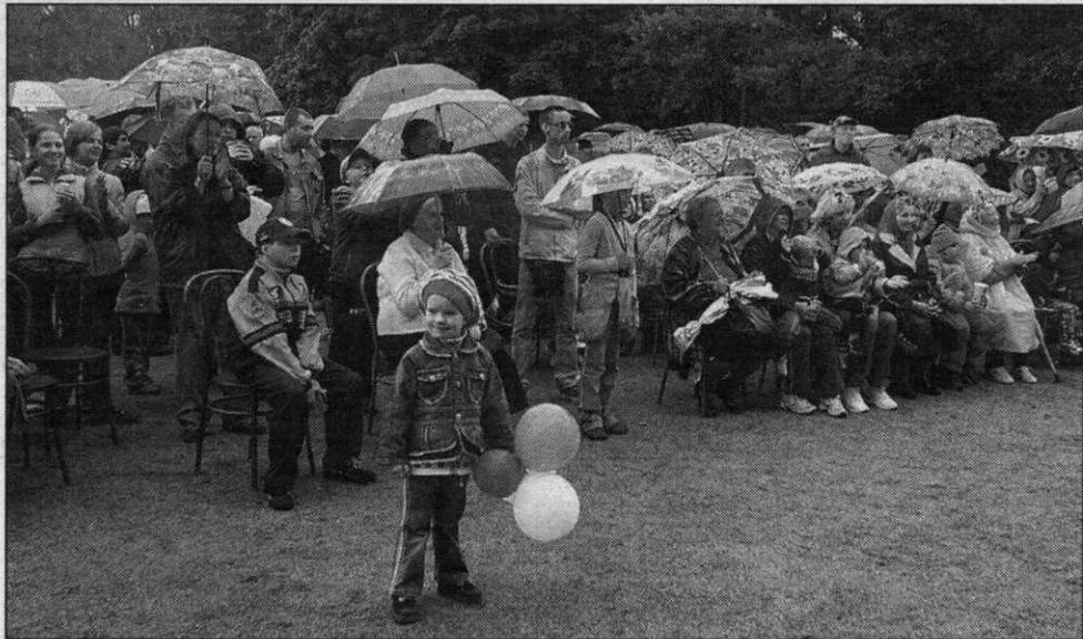
Открытие детской площадки во дворе дома № 282 по Приморскому шоссе. Кто знает, быть может, кто-то из местных ребятшек, резвящихся сейчас на площадке «Сестрорецкого Кремля», в будущем может оказаться хозяином Кремля московского.