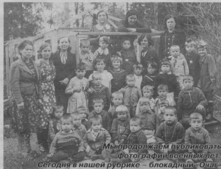
Мы продолжаем публиковать фотографии военных лет. Сегодня в нашей рубрике – блокадный «Очаг»

нимская вспоминает, как в домике с резными наличниками, расположенном почти напротив муниципального совета, в блокаду умирала девушка. Военные получили приказ обойти