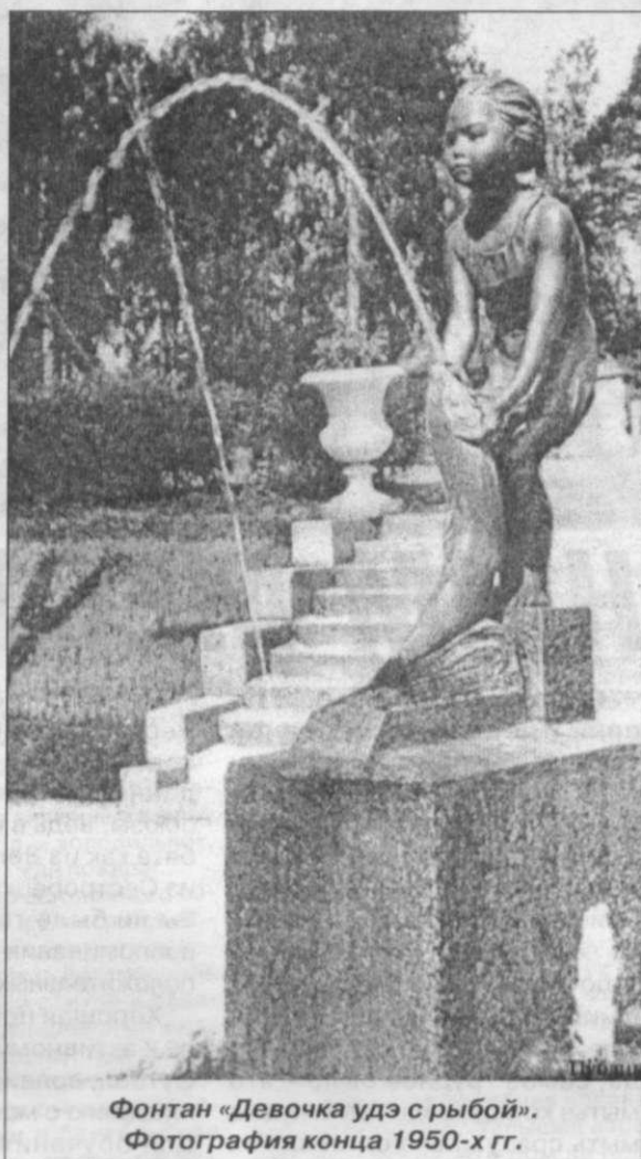
Фонтан «Девочка удэ с рыбой». Фотография конца 1950-х гг.

терьеры кинотеатра «Дружба», молочного кафе «Ленинград», табачного магазина «Гавана» на Кировском проспекте (1952-1953 гг.), построен Дом художников на Песочной набережной (1961 г.). В те же годы он много времени уделял работе по благоустройству парков Ленинграда. Совместно с архитектором Е.Н.Сандлером и скульптором Г.П.Якимовой Лапиров подготовил к публикации альбом проектов малых архитектурных форм – своеобразное руководство по благоустройству населённых пунктов. К сожалению, этот альбом так и не был издан.