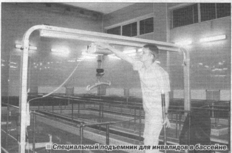
■ Специальный подъемник для инвалидов в бассейне

Еще будучи полномочным представителем Президента России в Центральном Федеральном округе, Георгий Полтавченко передал в дар сестрорецкому храму частицы святых мощей Петра и Павла. Произошло это в 2009 году в день освящения храма Патриархом Московским и Всея Руси Кириллом. После посещения православно-исторического ансамбля губернатор Санкт-Петербурга отправился в 40-ю больницу, где главный врач Сергей Щербак рассказал о достижениях крупнейшего в Санкт-Петербурге многопрофильного стационара по внедрению новейших методик восстановительного лечения и безоперационных вмешательств на сердце и сосудах.