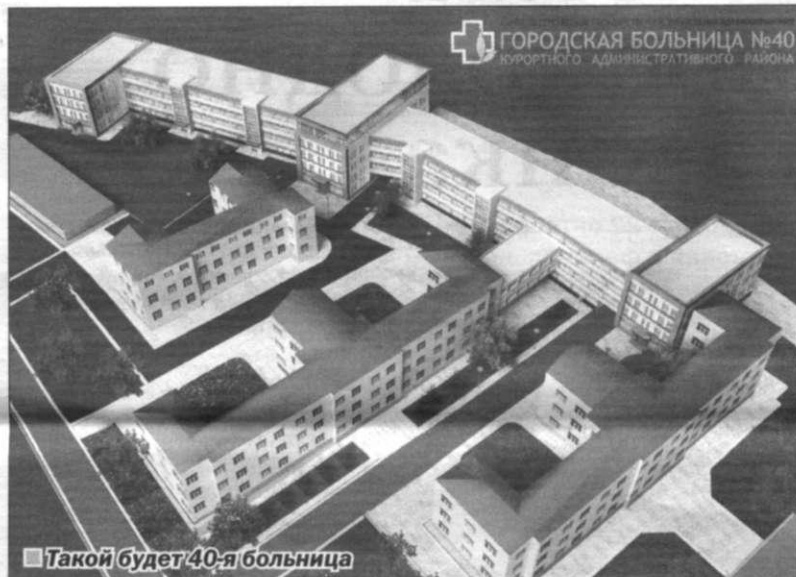
■ Такой будет 40-я больница

ГОРОДСКАЯ БОЛЬНИЦА №40 КУРОРТНОГО АДМИНИСТРАТИВНОГО РАЙОНА