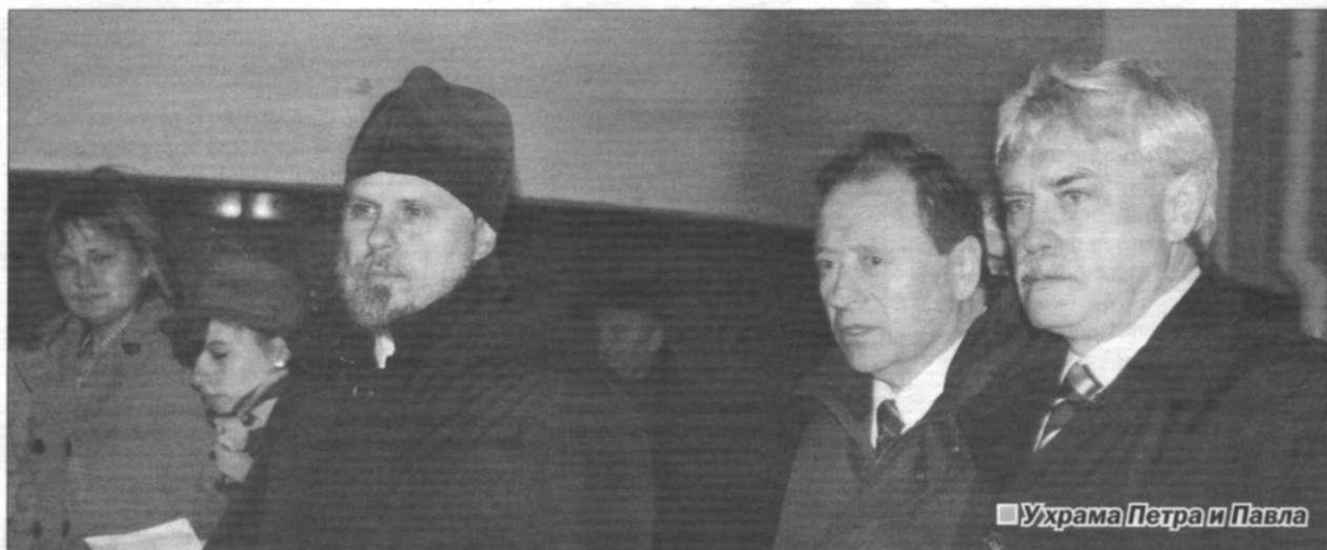
■ У храма Петра и Павла

— Объезд Курортного района — часть моего рабочего плана. Я недав-