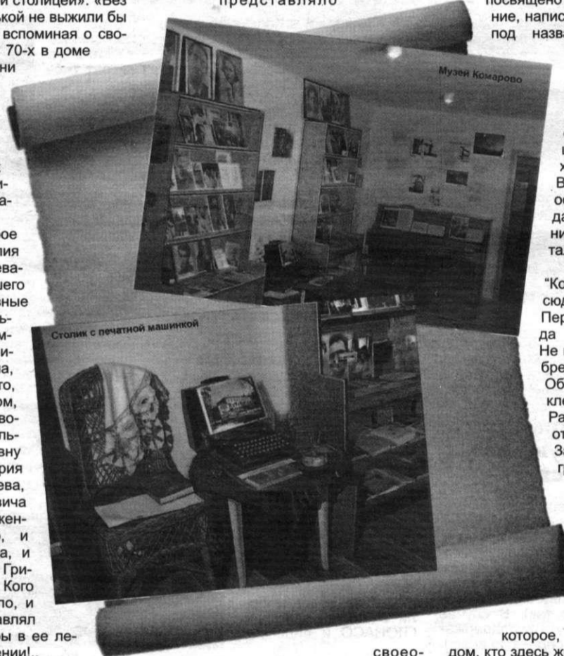
Стол с печатной машинкой