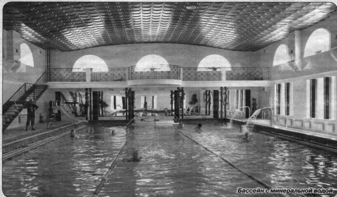
Бассейн с минеральной водой

Санаторий «Сестрорецкий курорт» приглашает на отдых, оздоровление и реабилитацию в любое время года и предлагает эффективное лечение заболеваний: