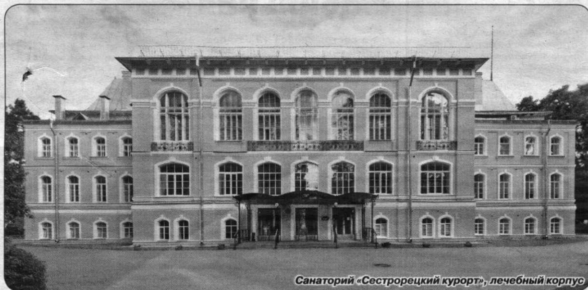
Санаторий «Сестрорецкий курорт», лечебный корпус

ка со всего Петербурга. Уже вскоре после своего открытия санаторий был удостоен высшей награды «Grand-Prix» на Всемирной выставке здравоохранения в бельгийском курортном городке Спа. Это была настоящая победа основателя курорта П.А.Авенариуса и его единомышленников. С это-