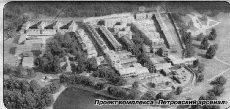
Проект комплекса «Петровский арсенал»