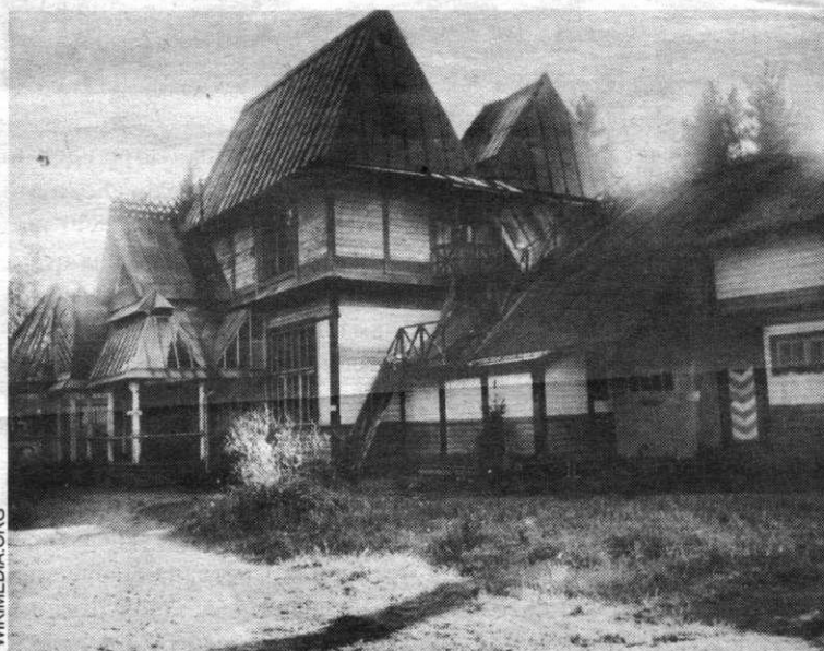
■ Дом И. Е. Репина в усадьбе «Пенаты» сразу после Финской войны

Указом Президиума Верховного Совета РСФСР от 1 октября 1948 года бывшему финскому населенному пункту Оллила было присвоено наименование «поселок Солнечное». По официальной версии поселок Солнечное назван так в память о постановке здесь, на сцене летнего театра, в 1904 году пьесы Максима Горького «Дети солнца».