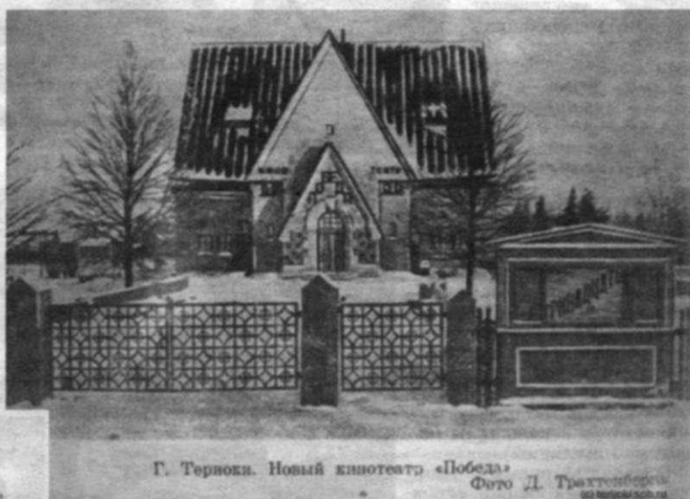
Г. Терйоки. Новый кинотеатр «Победа»

их потомки. В Финляндии есть общество «Терийоки», в котором собираются люди, интересующиеся историей и озабоченные тем, чтобы их дети и внуки тоже интересовались – поэтому несколько раз в год они приезжают. Приезжают и просто так, и на День Города Зеленогорска, на Рождество, обязательно – на Пасху. Они очень доброжелательные и очень активные.