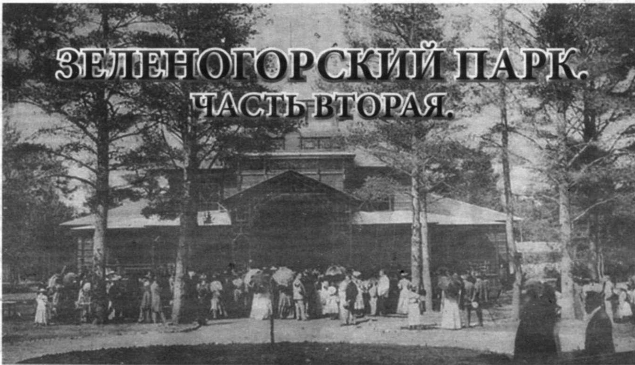
Терийоки. — Курзалъ.