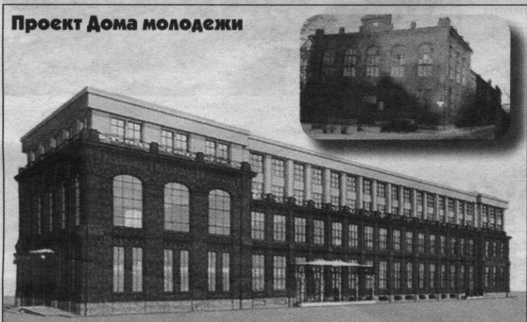
Проект Дома молодежи