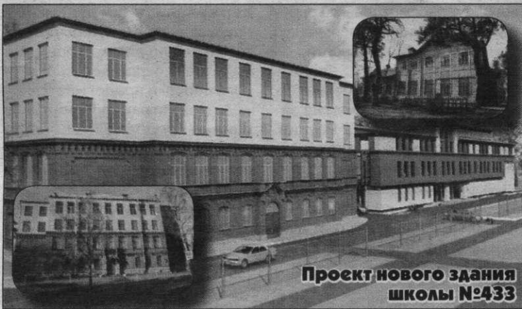
Проект нового здания школы №433