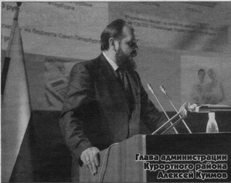
Глава администрации Курортного района Алексей Куимов