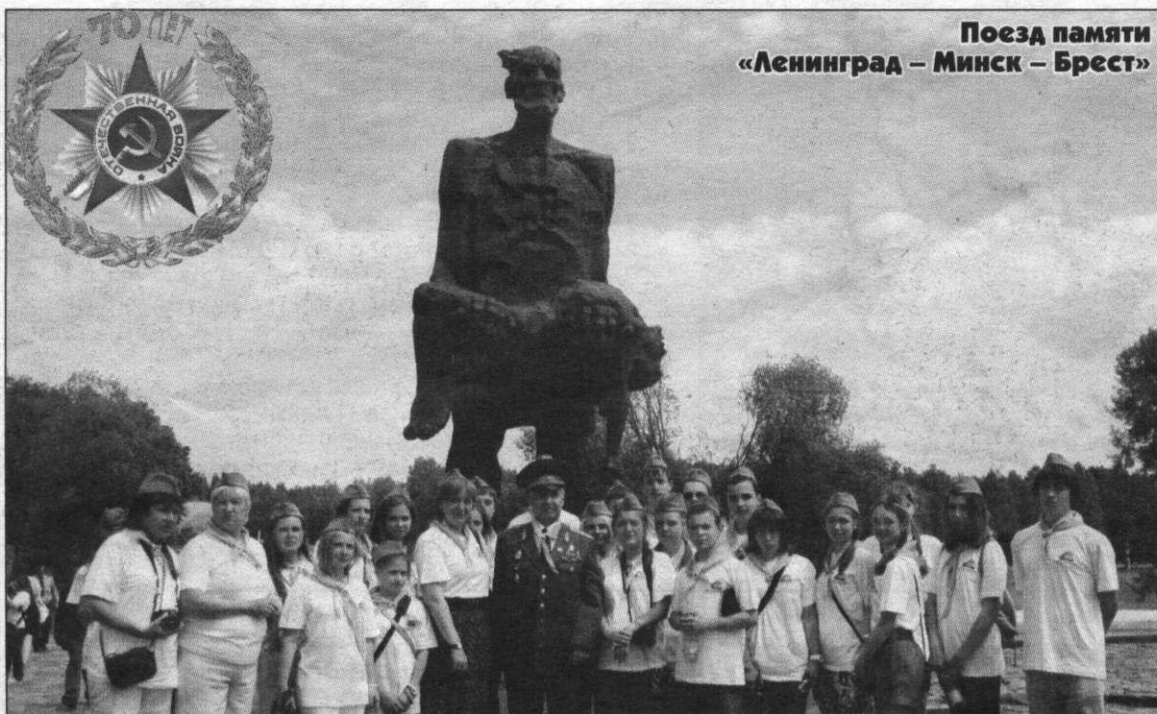
Поезд памяти «Ленинград – Минск – Брест»