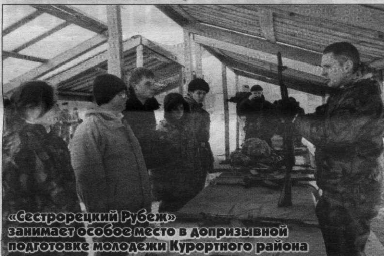
«Сестрорецкий Рубеж» занимает особое место в допризывной подготовке молодежи Курортного района

Кроме того, в 2015 году ожидается существенное расширение районной системы видеонаблюдения. Комплексно будут установлены сотни «умных» видеокамер на улицах и в парадных жилых домах, а также десятки камер фото-видео-фиксации на дорогах.