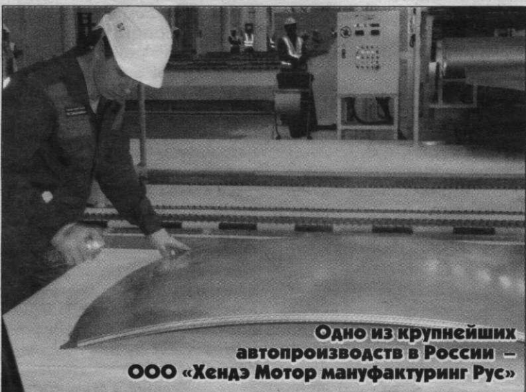
Одно из крупнейших автопроизводств в России – ООО «Хендэ Мотор мануфактуринг Рус»