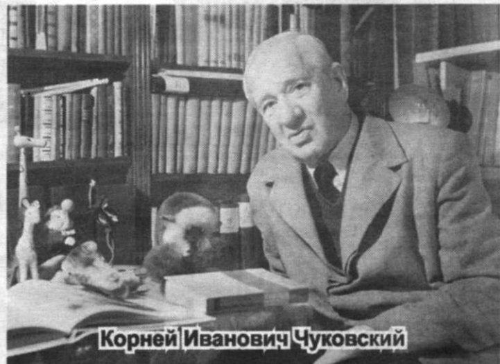
Корней Иванович Чуковский

Корней Иванович мог писать о самых трудных вещах, и каждому был понятен. Всегда естествен, доступен и прост. Куда бы он ни пришел — мгновенно завладевал вниманием каждого и каждой аудитории. Вся жизнь его прошла в людском окружении. Где Корней