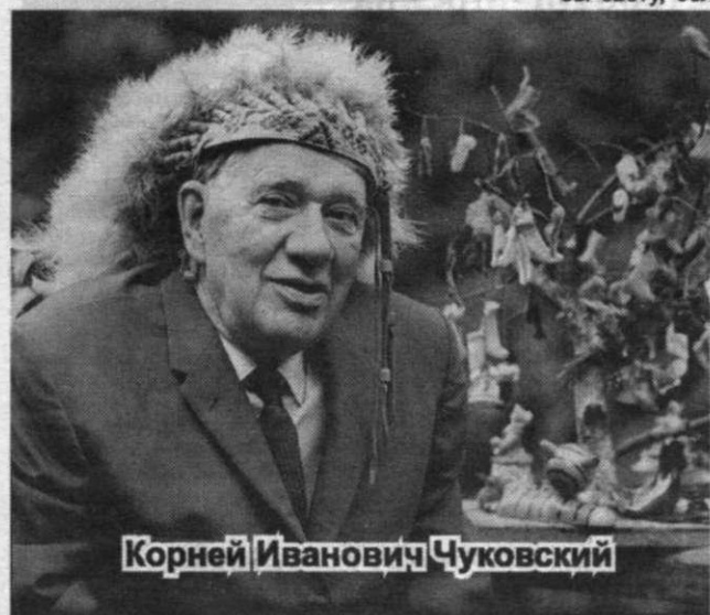
Корней Иванович Чуковский

Детский писатель, глубокий исследователь детского творчества и детской психологии, тонкий, острый и дальновидный критик, историк русской литературы, неутомимый собиратель рукописного наследия Некрасова, лучший истолкователь его поэзии, его биограф, комментатор, редактор, остроумнейший публицист. Вдохновенный защитник русского языка от всех, кто небрежно в обращении со сло-