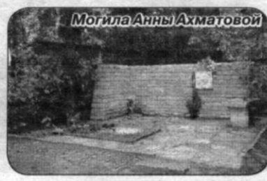
Могила Анны Ахматовой