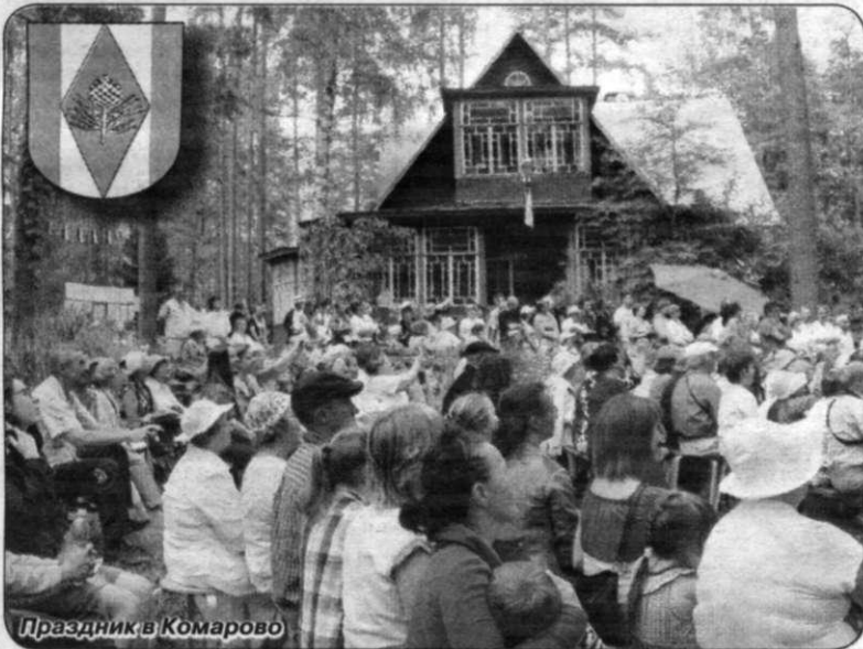
Праздник в Комарово