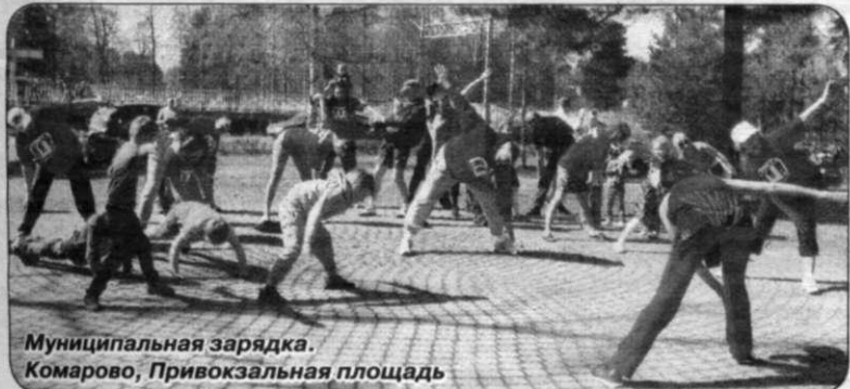
Муниципальная зарядка. Комарово, Привокзальная площадь