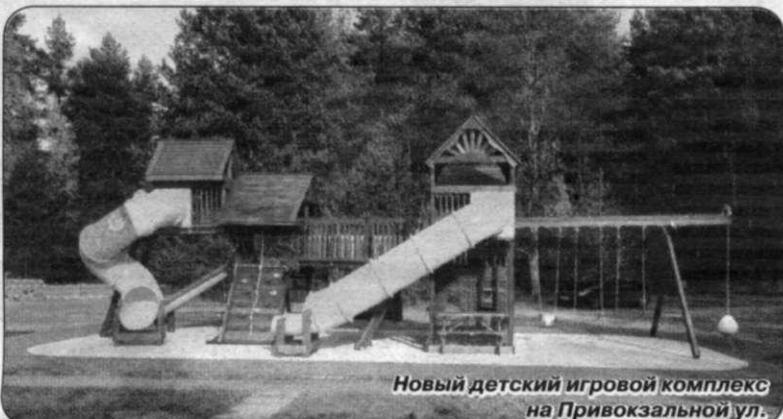
Новый детский игровой комплекс на Привокзальной ул.