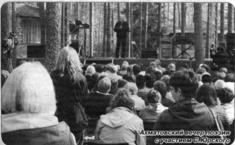
Ахматовский вечер поэзии с участием С.Юрского