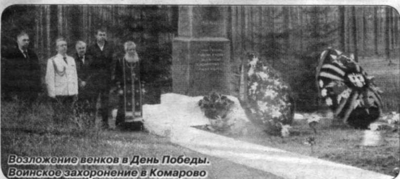
Возложение венков в День Победы. Военское захоронение в Комарово