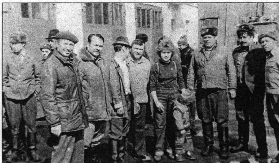
Пожарные отдельного поста №1 на Ленинском субботнике 20 апреля 1985 года.