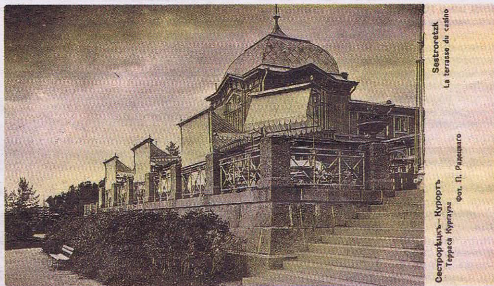
Sestroretsk La terrasse du casino Сестрорецк-Курорт Терраса Курорта

Реабилитационный центр «Детские дюны» — неоднократный победитель Всероссийского форума «Здравница». Так в 2017 году ему было присвоено звание «Лучшая детская здравница Российской Федерации». Санаторий получил положительную оценку Общественной палаты