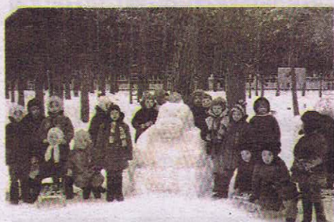
В детском санатории «Жемчужина» детей успешно лечили как в советское время, так и сегодня

Сегодня городская больница №40, как и здравницы Курортного района, сохраняя свою богатую историю, активно развивают направления реабилитации и санаторно-курортного лечения.