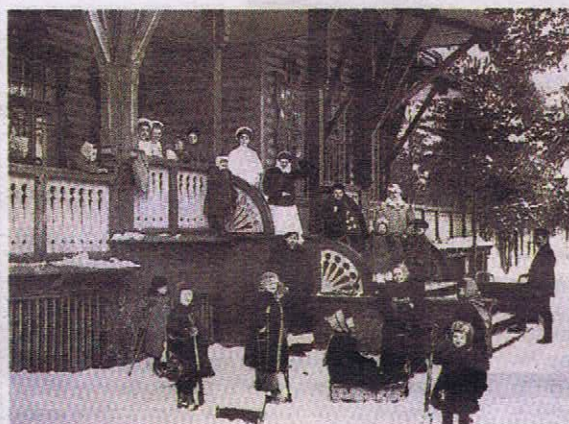
Санаторий «Детские дюны» в начале XX века (фото слева) и современный вид детского реабилитационного центра

проживали в приюте великой княгини Марии Николаевны (Мариинский приют). Открытие этого корпуса позволило лечить и поправлять здоровье брошенных бедных детей.