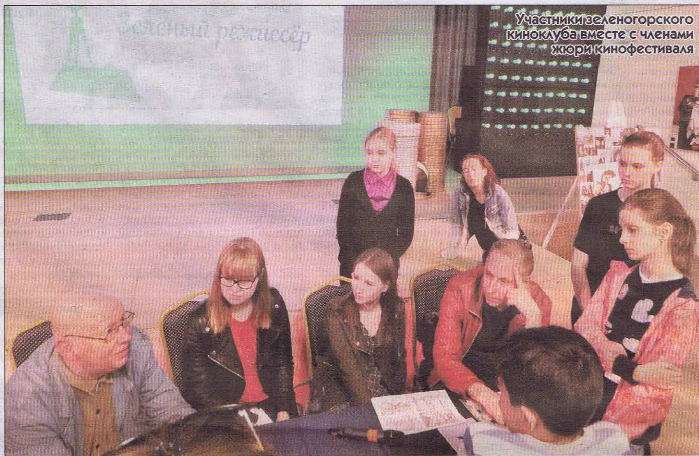
Участники зеленогорского киноклуба вместе с членами жюри кинофестиваля

В Курортном районе завершился Второй кинофестиваль подростковых фильмов «Зеленый режиссер».