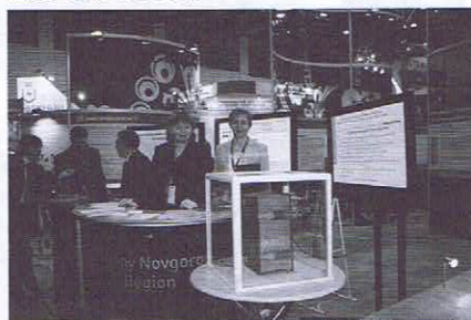
Выставочная экспозиция НГОУНБ на XIV Международном форуме «Россия единая», Нижегородская ярмарка (2009 г.)

Апробированный и успешно подтвержденный опыт организации профильных сельских информационных центров (аналоги модельных библиотек), которые создаются в области с 2003 года, лёг в основу областного плана модернизации сельских учреждений культуры на 2008–2010 годы. Сельские информационно-компьютерные центры (их сейчас 128) были созданы по алгоритму, разработанному специалистами НМС НГОУНБ.