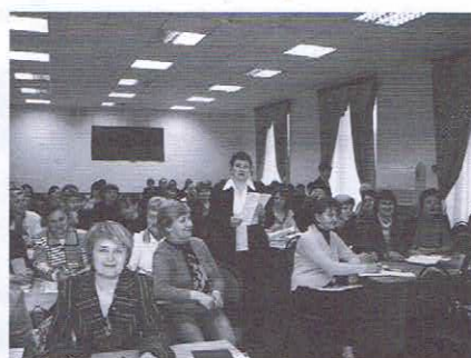
Областная творческая лаборатория «Читающая семья — читающая нация» на базе «Борского межпоселенческого инновационно-методического центра», 2008 г.

Время довольно быстро расставляет всё на свои места: уже в текущем году в области пошёл обратный процесс: централизуется самая первая децентрализованная ЦБС — Вачского района, а вслед за ней — Павловского. Нельзя сказать, что децентрализованным библиотекам жилось хуже. В Вачском районе, например, сельские библиотеки получили статус юридических лиц или вошли в состав юридического лица — сельского дома культуры. Экономиче-