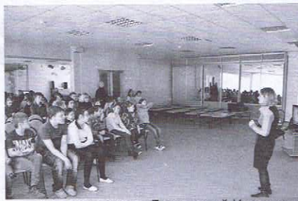
Выездная акция «Безопасный Интернет»

класс. За это время мы с ними становимся практически родными. Воспитатели ставят особые условия для посещения компьютерных занятий: поведение должно быть примерным. Это серьёзный стимул для детей. Воспитатели неоднократно отмечали улучшение в поведении и учёбе ребят. С огромной радостью