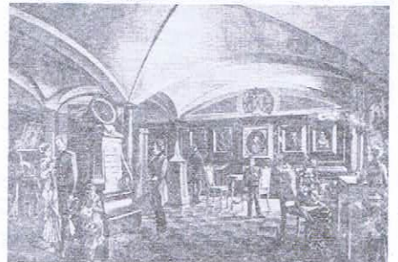
Лермонтовский музей. Экспозиционный зал. 1884

ные гв. артиллеристами, формы одежды и вооружения, модели материальной части, старинные сочинения по артиллерии и уставы и т. п.» 7 . В конце статьи заведующий музеем П. П. Потockий обращался к родственникам и читателям журнала с просьбой направлять допол-