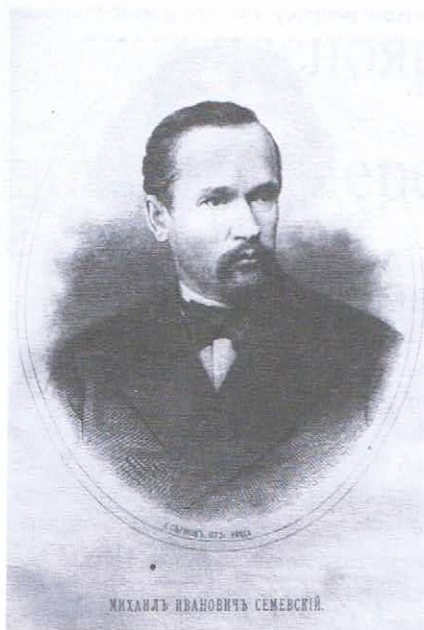
МИХАИЛЪ ИВАНОВИЧЪ СЕМЕВСКІЙ.

начально он существовал при педагогической библиотеке военно-учебных заведений, а с 1871 г. переведён в центр Петербурга, в так называемый Соляной городок. Первым директором музея был В. П. Коховский, который приложил немало сил для его становления и