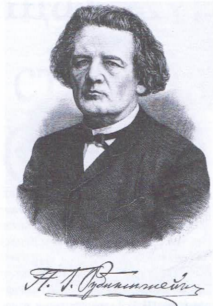
А. Г. Рубинштейн

с императорским периодом отечественной истории и историей русской литературы, но и широко освещал другие темы, в частности музей Петербурга. Инициатива М. И. Семевского по созданию музея, посвящённого истории Петербурга, выступления в Городской думе по этому вопросу, участие в музейной жизни