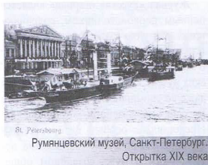
Румянцевский музей, Санкт-Петербург. Открытка XIX века

В 1907 г. вышла в свет статья А. А. Антонова «К 175-летней годовщине Первого кадетского корпуса» 8 , в которой описывается жизнь и быт кадетов и упоминается о малоизвестном музее