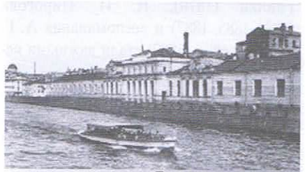
Педагогический музей военно-учебных заведений

Журнал «Русская старина» является ценным первоисточником, сохраняющим историко-культурное наследие. В нём печатались статьи современников о малоизвестных и забытых петербургских музеях, которые в настоящее время даже не упоминаются в справочниках и Российской музейной энциклопедии. Представляет особый интерес статья «Исторический музей гвардейской артиллерии», о музее, созданном обществом офицеров л.-гв. 1-й артиллерийской бригады на Литейной улице, д. 26. Музей был открыт для всех желающих и представлял предметы, имеющие отношение к истории гвардейской артиллерии со времени её основания (1683 г.). Коллекция музея включала «батальные и бытовые картины, портреты гв. артиллеристов, их сочинения, рескрипты, грамоты и награды, получен-