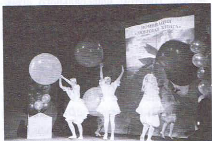
Церемония награждения победителей творческого конкурса среди детей и подростков «Антарное перо»

Задача содействия исторической памяти и литературного наследия через связь поколений решалась в рамках проекта «Курсом подвига и славы». В год 70-летия Великой Победы в патриотической акции «Письмо Победы» (организатор — детская библиотека им. Ю. Н. Иванова) принимали участие ученики 1–7-х классов. Юные участники акции написали и красочно оформили письма ветеранам войны, которые накануне Дня Победы торжественно вручили.