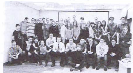
Интеллектуальная игра «Литературный дозор»

Инновационная форма просветительской работы — интеллектуальные игры «Литературный дозор» . Они ежемесячно привлекают десятки