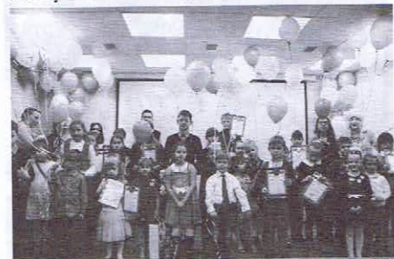
Награждение победителей семейного конкурса «Финансовая грамотность в моей семье — мы знаем, зачем это нужно»

Калининградской области. В рамках правительственных программ «Эффективные финансы» и «Повышение уровня финансовой грамотности жителей Калининградской области в 2011–2016 годах» получены гранты на разработку и реализацию игр для детей по финансовой грамотности (502 участника за 2015 г.); проведение семейного конкурса «Финансовая грамотность в моей семье: мы знаем, зачем это нужно» (приняли участие более 200 семей); организацию курсов повышения финансовой грамотности граждан области (50 человек старшего возраста в 2015 г.). Всего в библиотечных мероприятиях по финансовому просвещению приняло участие более 800 человек, партнёрами библиотеки стали более 40 общеобразовательных учебных заведений.