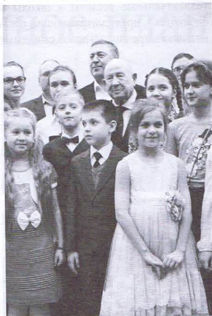
Награждение победителей конкурса творческих работ «Космическая Одиссея», посвященного присвоению библиотеке имени А. Леонова

космонавта А. А. Леонова можно говорить и о популяризации естественно-научной литературы.