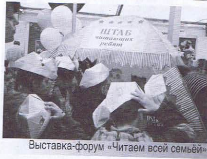
Выставка-форум «Читаем всей семьёй»

представителями культурного сообщества города Калининграда: писателями, поэтами, деятелями образования, культуры и искусства. Цель — освоение текстов классики, стимулирование интереса к чтению русской и зарубежной литературы. Инновационный блок «Нескучная классика» предусматривает театральные показы по литературным произведениям русских классиков и форум-спектакли по пьесам А. П. Чехова. Такие форум-театры можно назвать новым театральным методом для школ, библиотек и театров, задумывающихся о привлечении нового читателя и зрителя, ищущих новые способы актуализации классики.