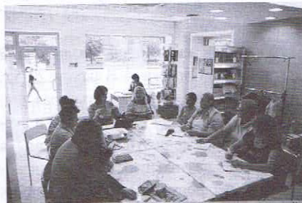
Занятие по проекту «Книга с фамилией»

В программе «От сердца к сердцу» финансовую поддержку благотворительного фонда «Добрый город Петербург» получил проект «Книга с Фамилией». Он направлен на поддержку межпоколенческих связей внутри семьи, уникальность истории каждой семьи, создание дополнительной сферы общения пенсионеров с их детьми и внуками. В результате еженедельных занятий более 50 калининградцев восстановили историю своих семей.