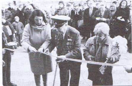
Присвоение имени Е. Зиборова библиотеке №5

В рамках программы осуществляется краеведческий проект «Именные библиотеки». В 2015 г. трём библиотекам были присвоены имена наших земляков: калининградского писателя-фронтовика, участника Восточно-Прусской операции Евгения Александровича Зиборова (библиотека №5 получила имя), калининградского поэта Сэма Симкина (библиотека №12), лётчика-космонавта, дважды Героя Советского Союза Алексея Архиповича Леонова (библиотека