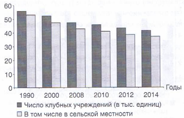
Рис. 1. Клубные учреждения Минкультуры России

По данным Главного информационно-вычислительного центра Минкультуры России, в неудовлетвори-