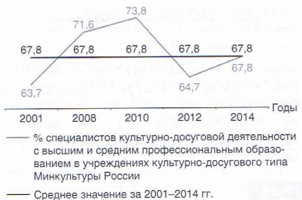
Рис. 2. Доля специалистов, имеющих высшее и среднее специальное образование, из числа основного персонала работников учреждений культуры клубного типа по России