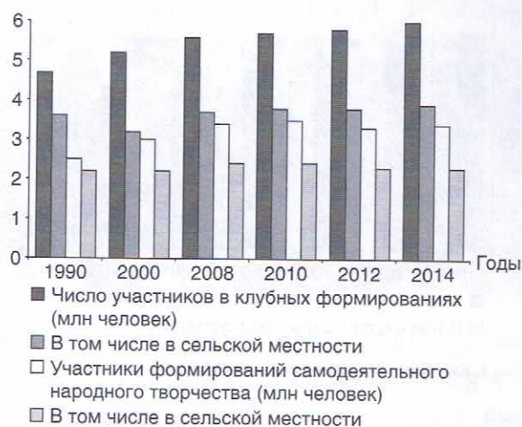
Рис. 4. Участники клубных формирований учреждений Минкультуры России

тельном состоянии находятся 25,4% от общего количества зданий, в которых расположены КДУ (для библиотек, например, эта доля составляет 8%) 1 . Однако столь неутешительные показатели не повсеместны: есть регионы, где сеть КДУ развивается и крепнет.