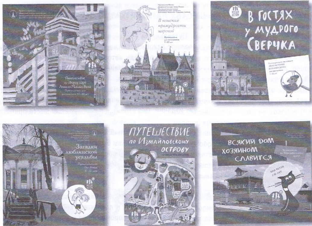
Рисунок 1. Детские путеводители музея-заповедника «Коломенское – Измайлово – Лефортово – Люблино»