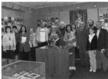
Дни российской литературы

В музее есть видеоархив, а также аудиозаписи песен, написанных на стихи Есенина; есть и записи с голосом поэта. Имеются в музее и книги: прижизненные издания; книги 1920–40-х гг., изданные после смерти поэта; книги с дарственными надписями родственников и знакомых Есенина... Всего библиотека В. И. Синельникова насчитывает более 600 томов.