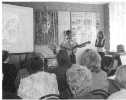
Литературно-музыкальный вечер, посвящённый образу С. А. Есенина в искусстве

Ежегодно проводятся мероприятия, приуроченные ко дню рождения С. А. Есенина (в октябре), а также традиционные декабрьские вечера памяти поэта. В 2008 г. вечер был посвящён значению песни в жизни поэта. Прозвучали русские народные песни, любимые песни С. Есенина, зрители услышали один из самых любимых музыкальных инструментов Сергея Александровича — гармонь (знаменитую есенинскую тальянку).