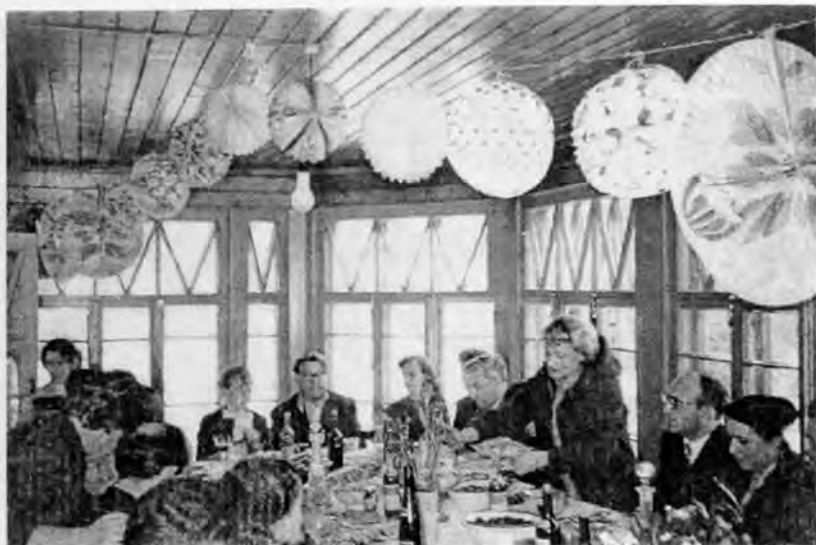
Праздник на комаровской веранде