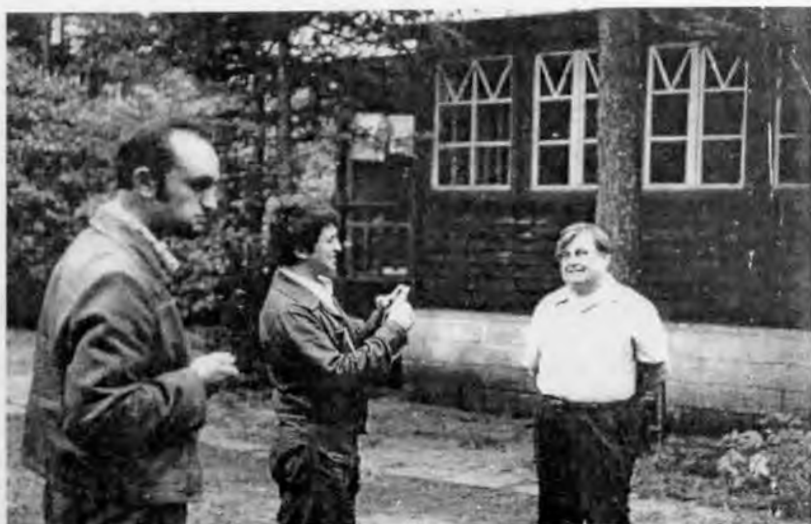
В Комарово с молодыми музыкантами

на вопрос: «Долго ли Вы работаете над песней?» ответил: «Одну из последних — «Письмо из экспедиции» — сочинял около года». Теряя в легкости, в продуктивности, он выигрывал в значительности, стремился расширить образный мир песни, искал и находил пути развития песенного жанра и своего личного творчества, новые темы, формы.