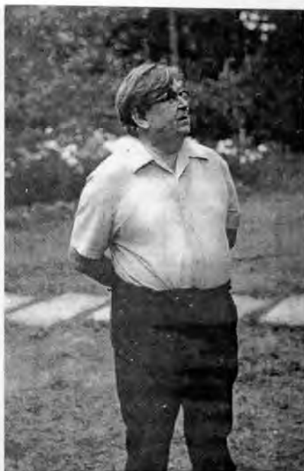
В шестидесятые годы