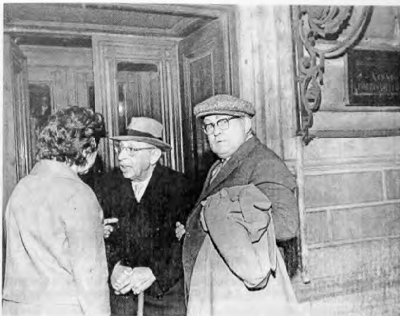
С Игорем Стравинским

Бытовые, жилищные условия были в Ленинграде нелегкими. Для того, чтобы облегчить композиторам творческую работу, Соловьев-Седой добился расширения Дома творчества композиторов в Репино, предоставления квартир, ссуд. Выкроить время для собственной работы становилось все трудней: то, что композитора в Ленинграде, можно сказать, все знали, многие с ним учились, дружили, открывало двери его квартиры на Фонтанке, в доме 131. Как руководитель, он был занят всю вторую половину дня и уставал много больше, чем от сочинения музыки.