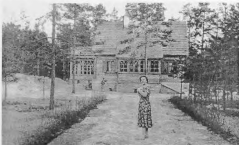
Дом в Комарово

оригинальность, но с учетом творческого комфорта и постоянного проживания: слева — утепленная веранда, в центре — столовая, рядом комната дочери и внуков, верхний этаж — комната жены. Скромнее всего был его кабинет, шагов семь-восемь в длину и