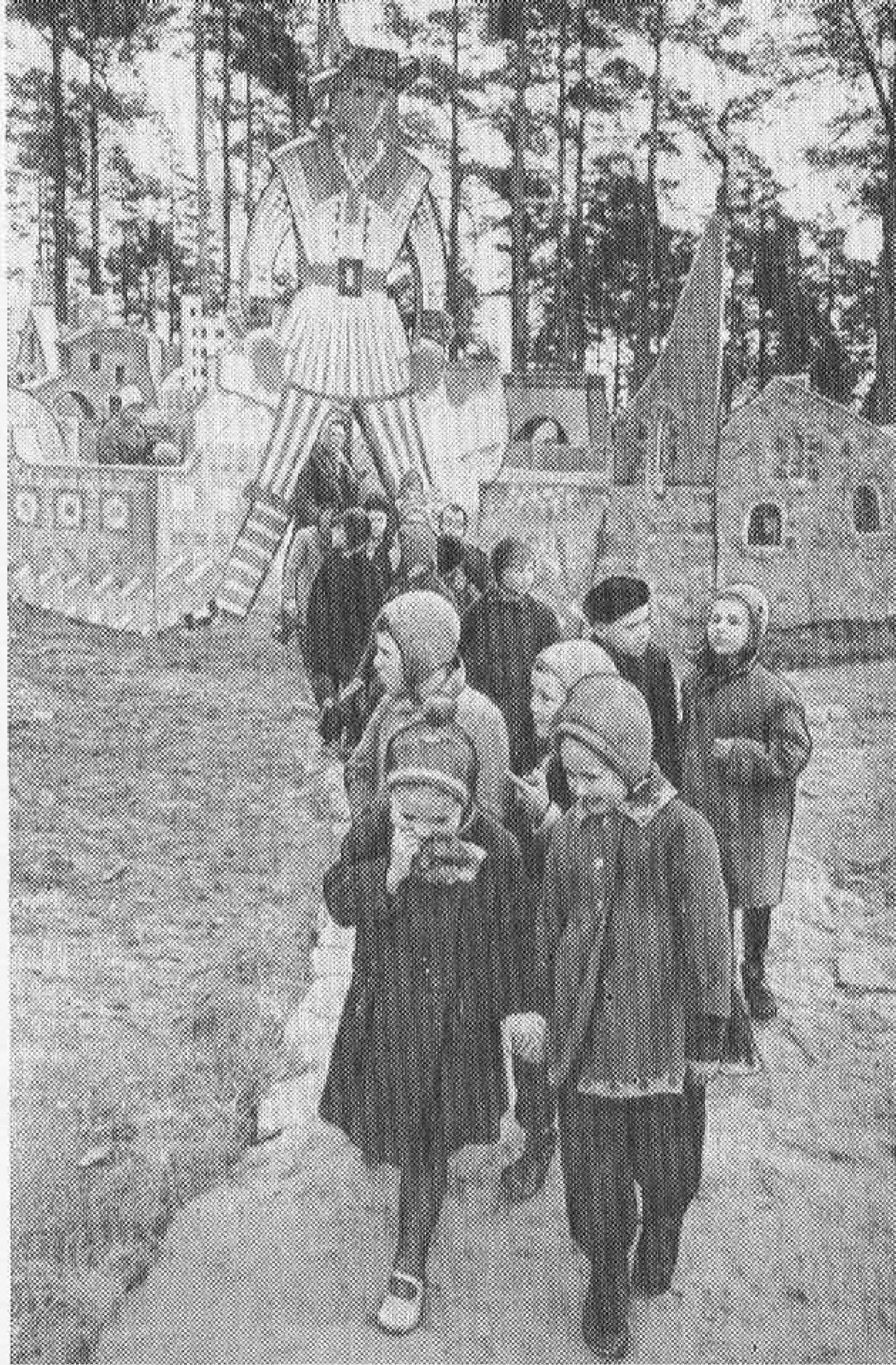
Сказочный уголок городка «Солнышко».