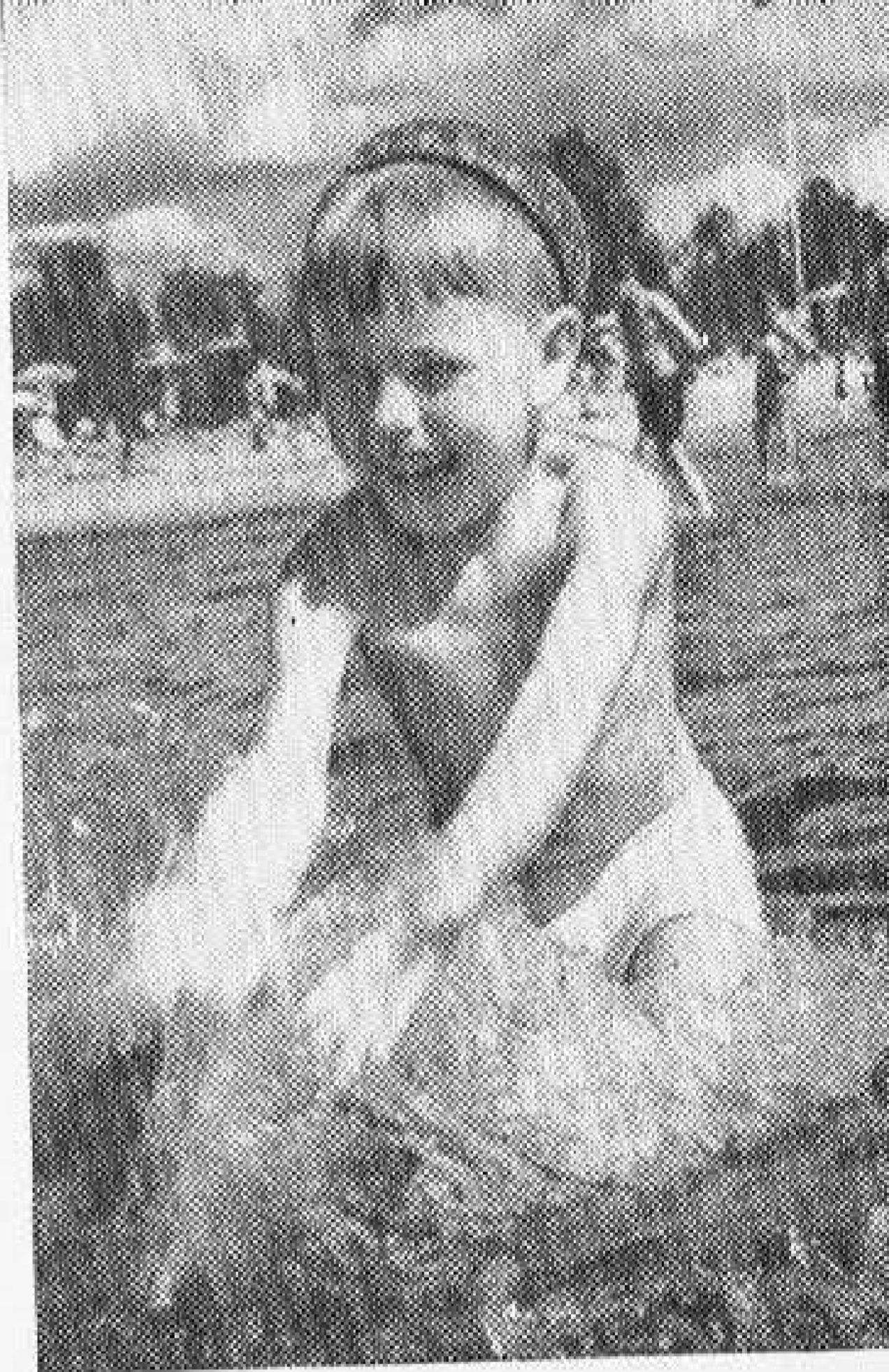
На Сестрорецком взморье.

Медицинские работники тщательно наблюдают за маленькими пациентами. Живут они на полном пансионе. Не менее пяти часов еже-