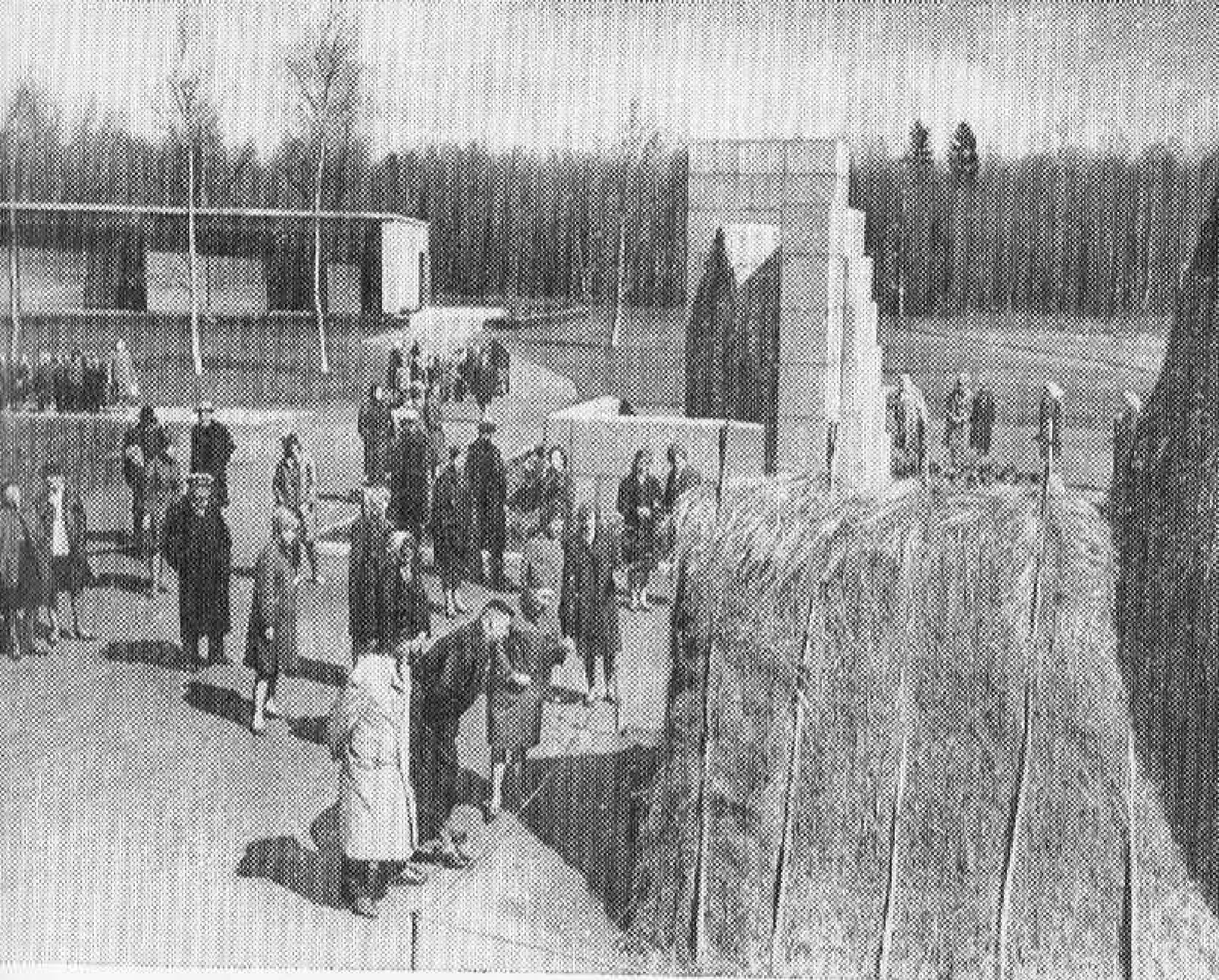
Разлив. Памятник-музей В. И. Ленина «Шалаш».

плотины, которая преградила русла рек Черной и Сестры. Водная поверхность озера составляет 12 квадратных километров, ширина и длина его доходят до 5—7 километров.