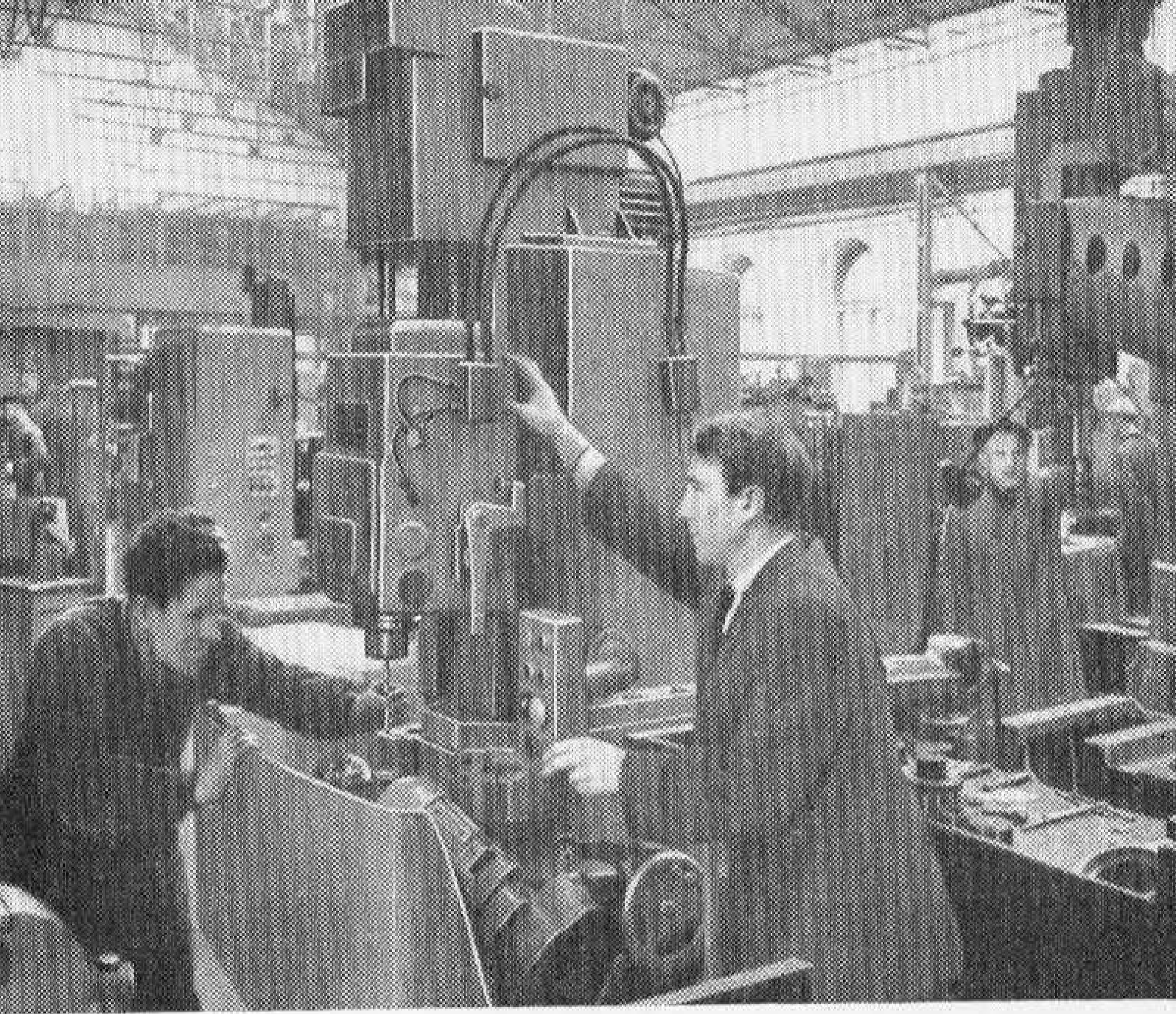
В одном из цехов Сестрорецкого инструментального завода имени С. П. Воскова.