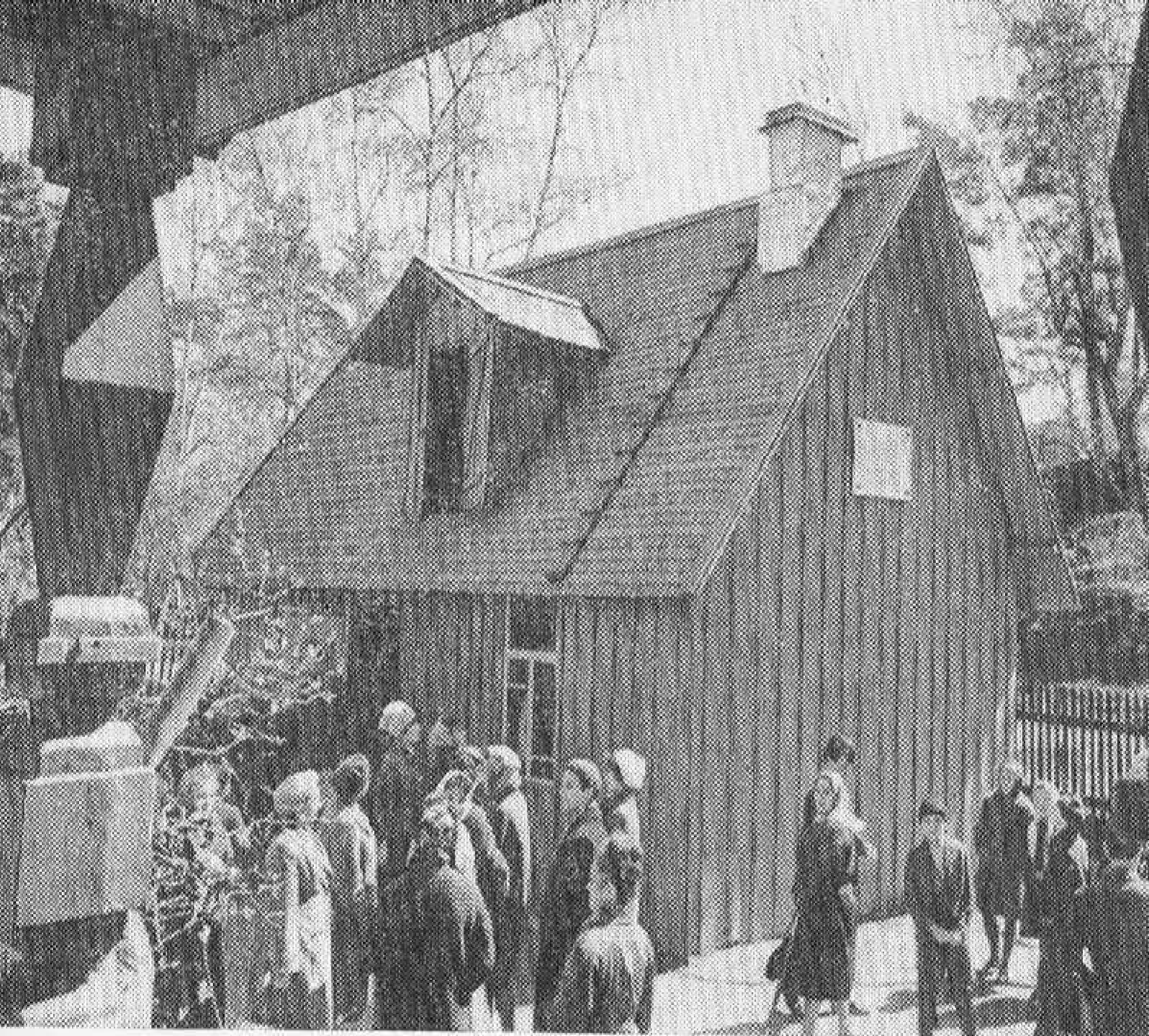
Разлив. Памятник-музей В. И. Ленина «Сарай».

революции, создателя первого в мире Советского государства.