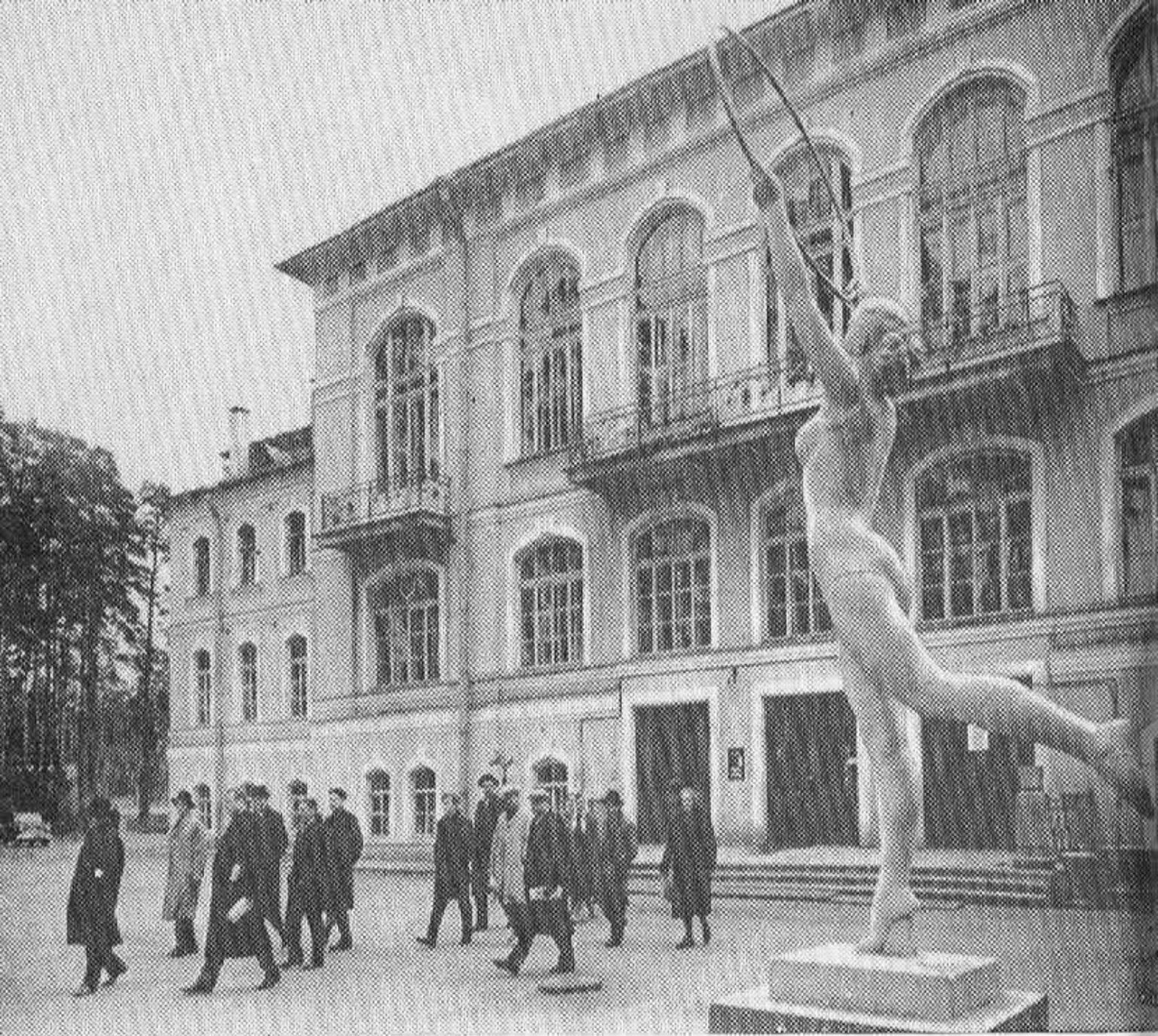
Главный корпус санатория «Сестрорецкий курорт».

Северная здравница располагает новейшим медицинским оборудованием, высококвалифицированными врачами. Постоянное совершенствование диагностики и лечения больных, внедрение в практику лечения новейших дости-