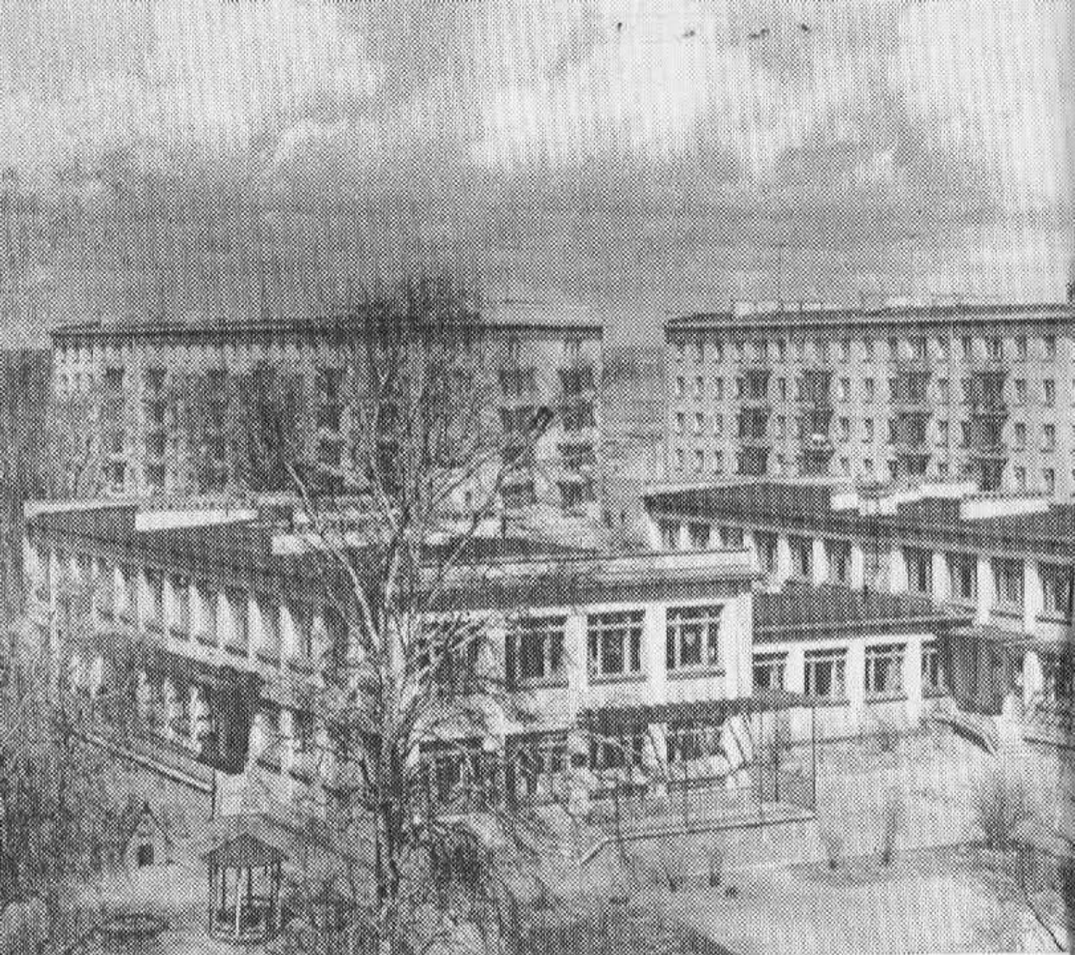
Новый жилой квартал