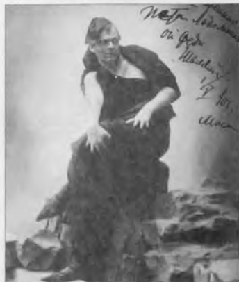
Ф. И. Шаляпин – Мефистофель. Милан, театр Ла Скала, 1901 г. Первое выступление за границей.