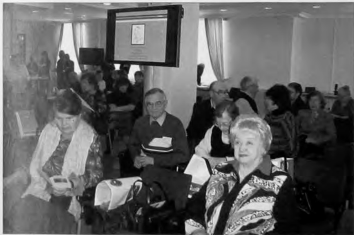
На Вторых Шаляпинских чтениях. 15.03.2013