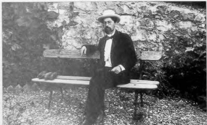
Антон Павлович Чехов (1860–1904)