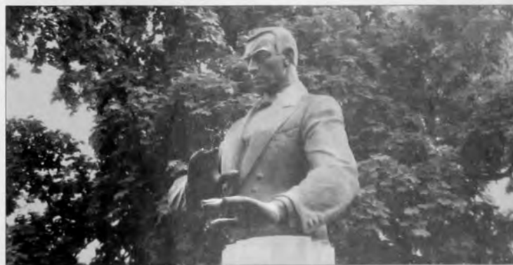
Памятник С. В. Рахманинову в Ивановке. 18.05.2013