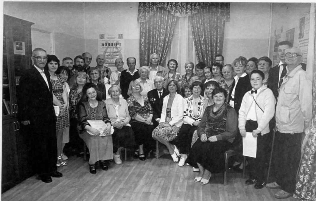
На открытии Шаляпинской гостиной