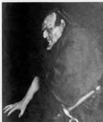
Ф. И. Шаляпин – Мефистофель. Нью-Йорк, театр Метрополитен- Опера, 1921 г.