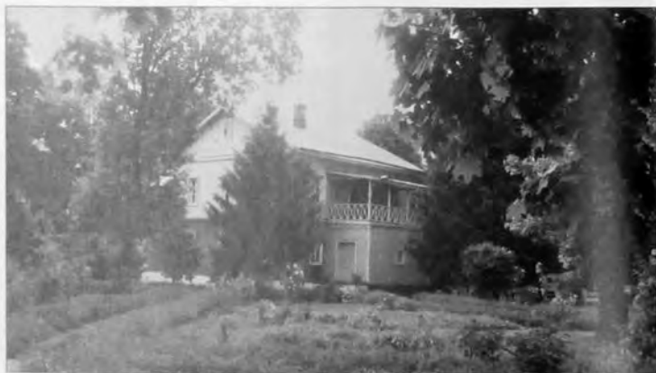
Музей-усадьба Ивановка С В Рахманинова в Тамбовской области. Вид из парка на флигель в котором жил С. В. Рахманинов со своей семьёй. 18.05.2013