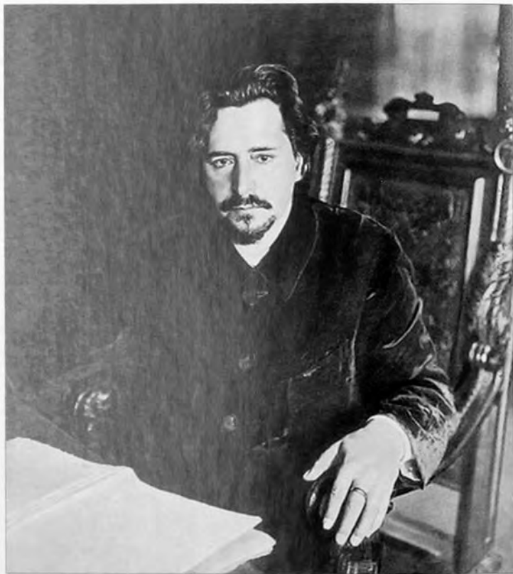
Леонид Николаевич Андреев (1871–1919)