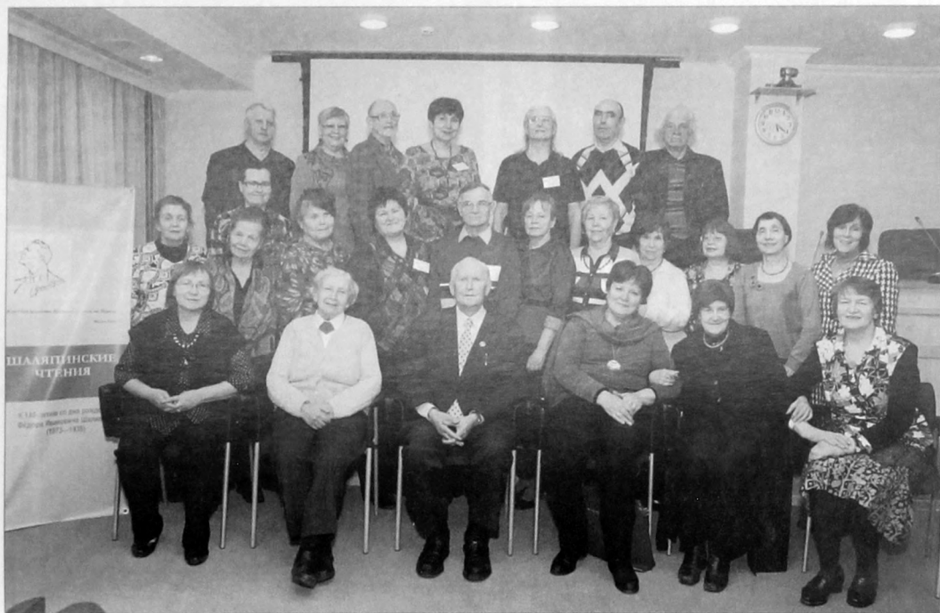
Участники Вторых Шаляпинских чтений. Библиотека им. Герцена, 2013 г.