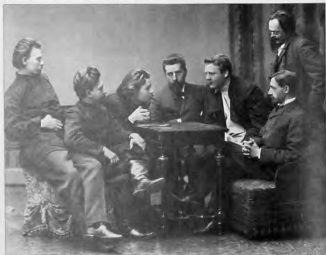
Участники «Среды»: С. Скиталец, Л. Андреев, А. Горький, Н. Телешов, Ф. Шаляпин, И. Бунин, Е. Чириков. 1902 г.