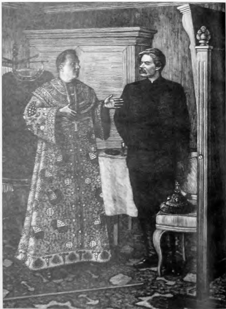
М. И. Поляков. Гравюра «После репетиции у Шаляпина». 1946 г.