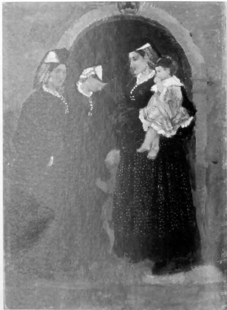
А. В. Исупов. «Итальянки с детьми». 1928 г.