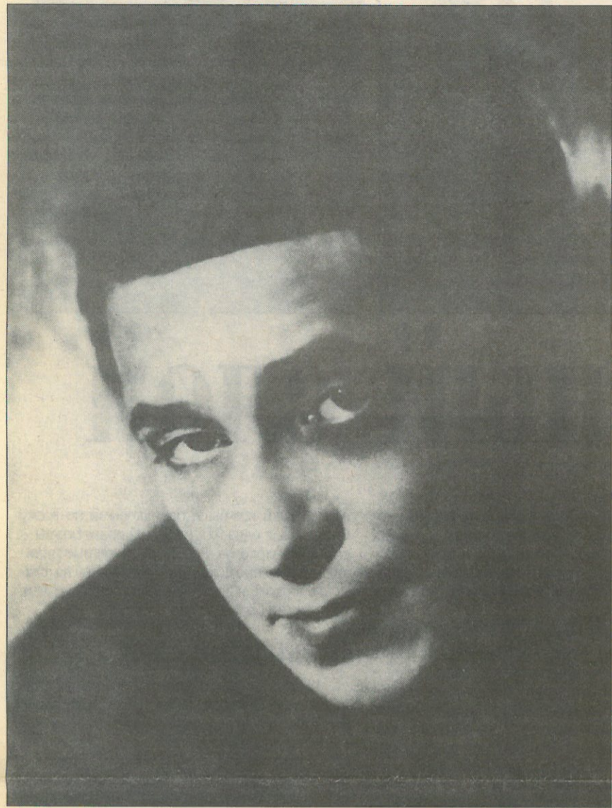
Фото Моисея НАППЕЛЬБАУМА, 1924 г.

К известному врачу однажды явился пациент с жалобой на апатию, отсутствие аппетита, затяжные приступы меланхолии. Как выяснилось, он перепробовал все средства, все лекарства, но ничего не помогает.