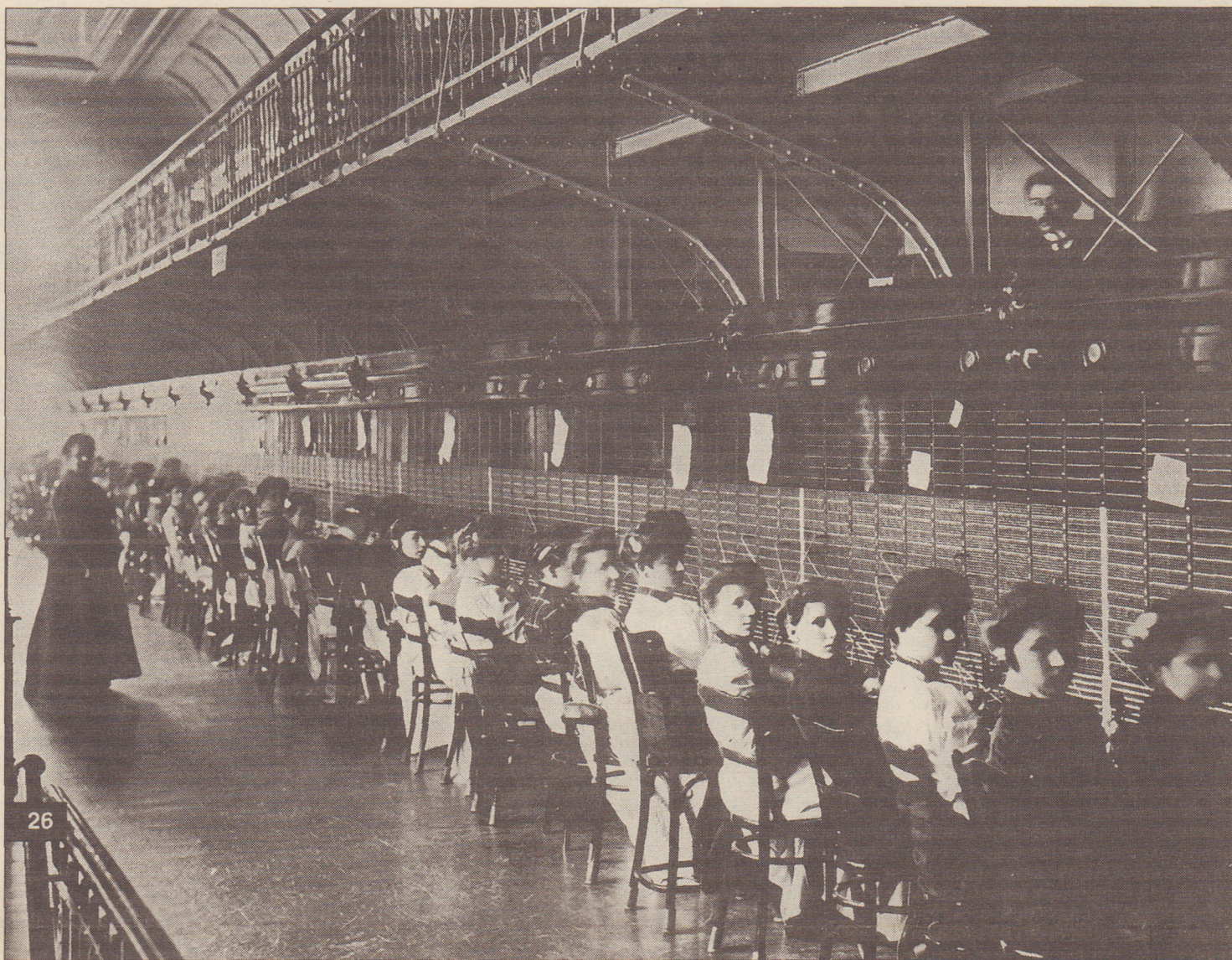
Одноминутный перерыв на центральной телефонной станции Санкт-Петербурга.

3) Плата за пользование телефонным сообщением установлена в 15 коп. за каждый отдельный разговор продолжительностью три минуты, не считая времени, необходимого для вызова, соединения требуемых аппаратов и вообще служебных переговоров.