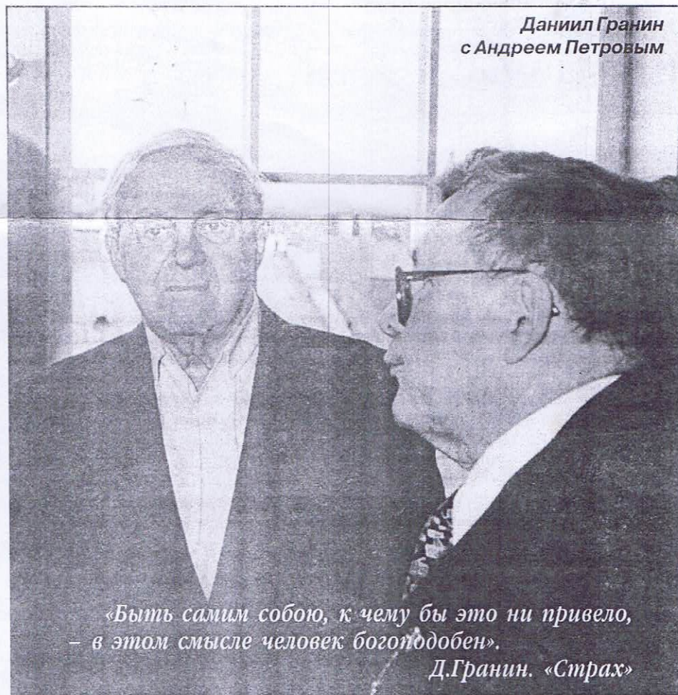
Даниил Гранин с Андреем Петровым

На Озерной улице в поселке Комарово уже более сорока лет живет на своей даче писатель Даниил Александрович Гранин. Имя Гранина в комментариях не нуждается. В справочнике «Кто есть кто в Санкт-Петербурге» перечисление его заслуг и наград занимает целую страницу. На глазах Даниила Гранина произошел расцвет и закат советской Империи, целая эпоха завершалась и начиналась новая, «великий город с областной судьбой» становился «культурной столицей», менялся и возвращался гимн, восходили и падали исторические фигуры - одним словом, длилась та симфония времени, в ритм которой вплетена его биография. Кто-то заметил, что история - это самопознание. Умное, мудрое долголетие - дар Провидения, которое позаботилось, чтобы одаренный не скучал, резко меняя драму его судьбы, обогащая опытом, испытывая на прочность, отнимая и восполняя.