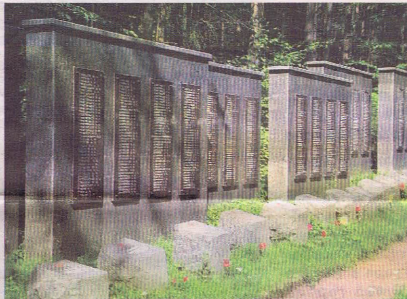
Стела Памяти на Сестрорецком мемориальном кладбище воздвигнута к 60-летию Победы в 2005 году.

За последние два года по инициативе депутатов Муниципального Совета Сестрорецка изданы две книги, которые имеют важнейшее значение в сохранении памяти о военном лихолетье на земле нашего района. В 2004 году издана книга "Блокада. Сестрорецкий рубеж" - издание уникальное, хотя бы потому, что раньше историки обходили должным вниманием Сестрорецкий рубеж обороны Ленинграда - в силу того, что здесь стояли финские войска и проходила граница с Финляндией. Основанная на воспоминаниях участников тех страшных событий - сестроречан, книга внесла свой вклад в восстановление истины. Важно, что работали над ней и юные краеведы.