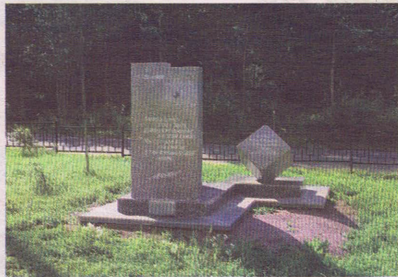
В квартале 38 установлен памятник жертвам радиационных и техногенных аварий и катастроф, обустроен сквер.