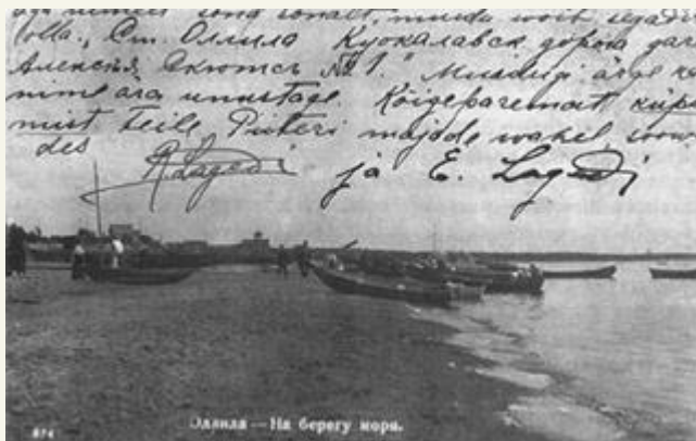
На берегу моря в Оллила. Открытка. Начало XX века