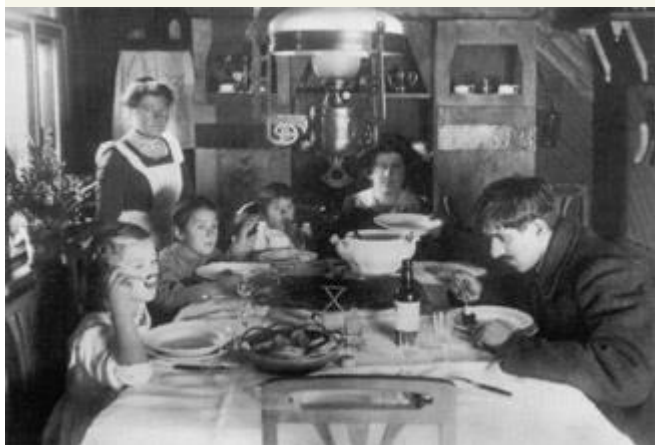
Семья Чуковских за обедом. Куоккала. 1912 год

Наконец, в Оллила и Куоккала, как и в столице, проходили артистические журфиксы. Так, Владимир Маяковский, снявший здесь дачу за 65 рублей, которые выиграл в лотерею, постоянно нуждался в деньгах, ему не хватало даже на еду. Тогда он «установил семь обедающих знакомств». По воскресеньям, когда собирались у Чуковских, он «объедал» Корнея Ивановича, в понедельник – другого дачника, театрального режиссера и критика Николая Евреинова, и так далее. По средам собирались у вегетарианца Репина. «Ем репинские травки, – вспоминал позднее поэт. – Для футуриста ростом в сажень – это не дело». Кого только не бывало на этих еженедельных обедах. Дочь Чуковского Лидия Корнеевна рассказывала: «К моему отцу по воскресеньям приезжали из Петербурга художники, писатели, актеры, поэты, историки литературы и публицисты. Девочкой я встречала у нас в доме Шалыпина, Маяковского, Н. Евреинова, Леонида Андреева, Владимира Короленко». Сам Чуковский писал: «Вокруг чайного стола затевались бурные, молодые, часто наивные споры: о Пушкине, о Достоевском, о журнальных новинках, также о волновавших нас знаменитых писателях той довоенной эпохи – Куприне, Леониде Андрееве, Валерии Брюсове, Блоке».