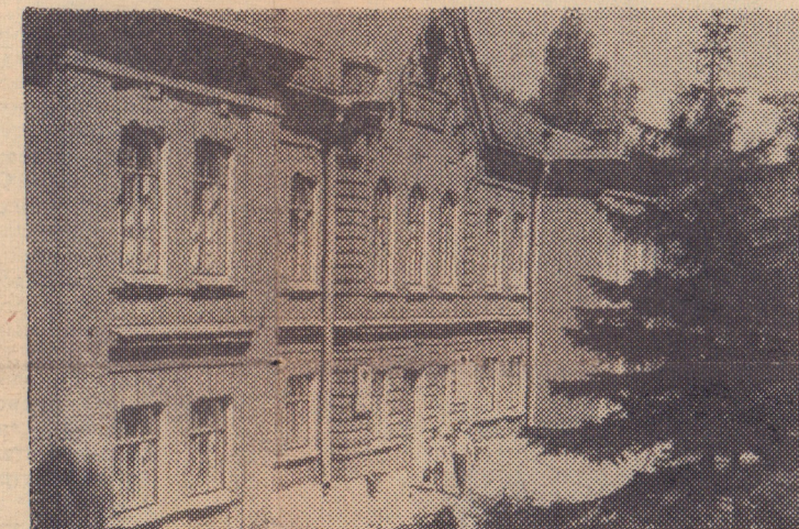
На снимке: у проходной завода.