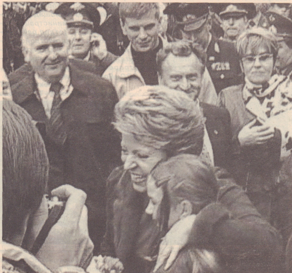
Сестрорецкая школьница вручила букет полевых цветов губернатору Санкт-Петербурга В.И.Матвиенко

Шествие горожан, народные гуляния, концерты на трех площадках.